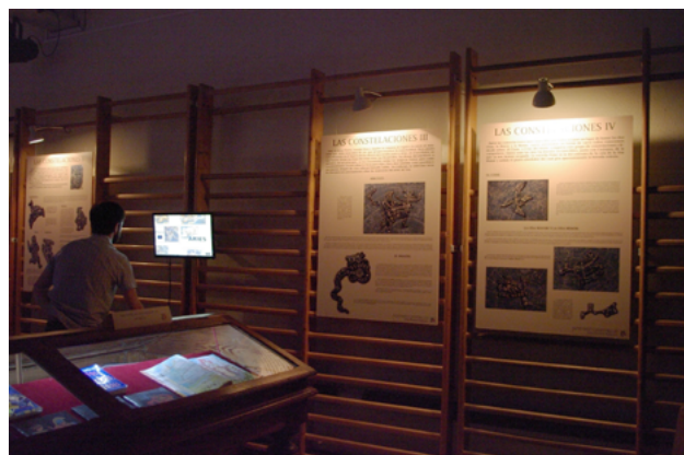
Figura 2. Aspecto parcial de la exposición NOSOTROS Y LAS ESTRELLAS

Los carteles iniciales se centran en explicar la historia del mapa y sus características técnicas, nociones como las de horizonte celeste, plano de la eclíptica y su importancia en nuestra visión del cielo, las coordenadas celestes, la precesión equinoccial y los nombres de las estrellas. Como hemos mencionado en los párrafos precedentes, casi todos ellos están tomados del libro de Torres Tirado. Pero destacado sobre el cartón pluma y con una tipografía adecuada permiten al visitante acceder al instante a una información sumamente pertinente para interpretar el mapa.