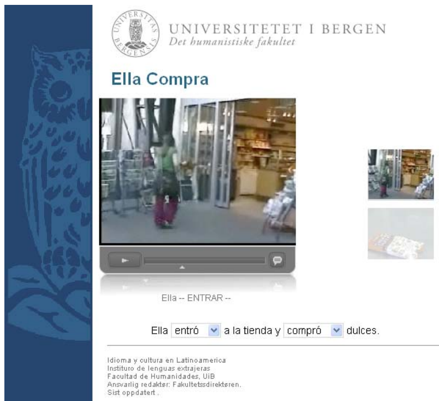
Imagen 6. Vista previa de una situación creada en el sistema.

Las investigaciones sobre el aprendizaje segundas lenguas han mostrado que este tipo de estrategias pueden apoyar la percepción del objeto específico que se quiera enseñar y consecuentemente pueden facilitar su aprendizaje (Blyth 2006:213).