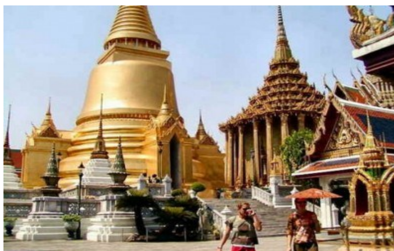
1 Turistas en Bangkok.

No solo los españoles visitan Tailandia, sino que el número de turistas que llegan al país procedentes de Argentina o México también está aumentando. No hay que olvidar que hay 21 países en el mundo donde el español es la lengua oficial y que por tanto muchos de los turistas que llegan a Tailandia tienen el español como primera lengua.