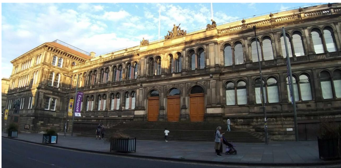
| Museo Nacional de Escocia

La National Gallery of Scotland abrió sus puertas para una visita privada. Durante esta visita, el director de la pinacoteca se dirigió a los participantes en el congreso para darles la bienvenida y presentar las características más destacadas del museo y su colección, con especial hincapié en las obras españolas que se exponen permanentemente (Velázquez, El Greco, Murillo y Zurbarán).