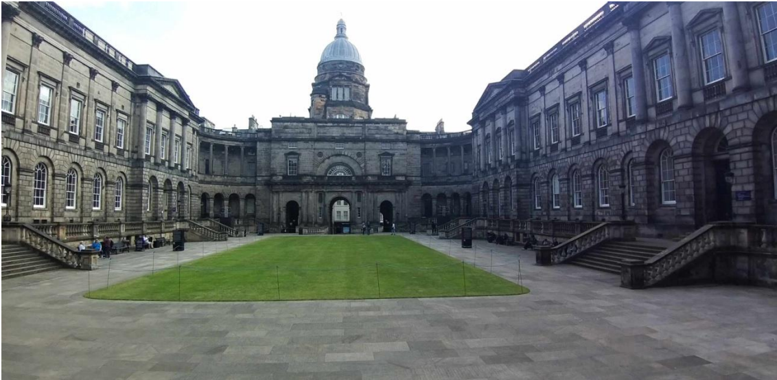
| Old College, Universidad de Edimburgo

Entre el 16 y el 20 de julio de 2024 se ha celebrado el 34.º Congreso Internacional de ASELE (Asociación para la enseñanza del español como lengua extranjera). La cita anual, que ha reunido a más de 350 profesores de español venidos de diferentes países y latitudes, ha tenido lugar esta vez en Edimburgo, siguiendo la costumbre instaurada por ASELE desde 2019 para alternar la organización de su congreso en ciudades españolas y en ciudades fuera de España: Oporto en 2019 y Verona en 2022 son los dos precedentes a esta cita en Edimburgo. Se persigue, así, otorgar a este encuentro una dimensión internacional e incrementar la presencia de ASELE en diferentes territorios, objetivo hacia el que se va avanzando, pues ya más de la mitad de los socios de ASELE son profesionales de la enseñanza del español que residen y trabajan fuera de España, en 73 países distintos.