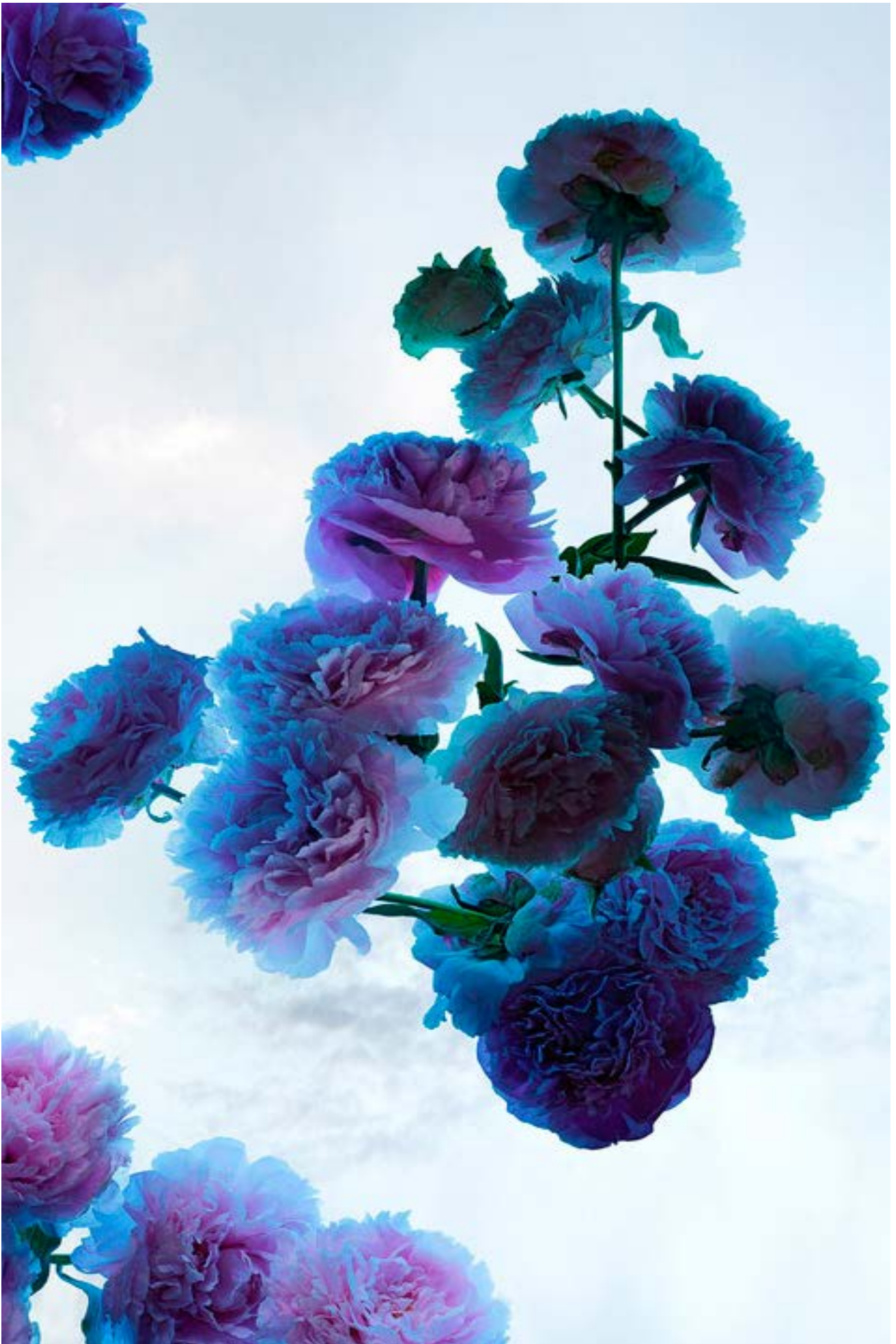
Gómez-Chao, Xurxo. (2017). A temporalidade da paisaxe I. (Detalle). Madrid: Galería BAT.