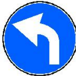
GIRAR / TORCER (ue) A LA IZQUIERDA POR...