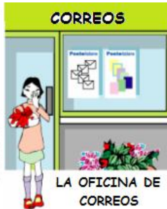
LA OFICINA DE CORREOS