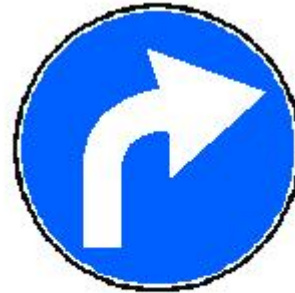
GIRAR / TORCER (ue) A LA DERECHA POR...