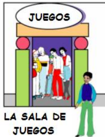
LA SALA DE JUEGOS