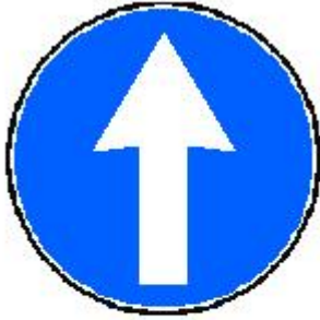
SEGUIR (i) TODO RECTO POR...