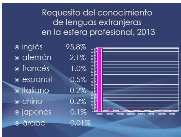
Figura 3. Conocimiento de lenguas extranjeras en la esfera profesional

No obstante, el estudio del mercado laboral realizado en 5 ciudades rusas de más de un millón de habitantes, de las 15 que hay en total, – Moscú, San Petersburgo, Novosibirsk, Ekaterinburg, Nizhny Novgorod – muestra que el conocimiento del español ocupa el cuarto lugar en la esfera profesional.