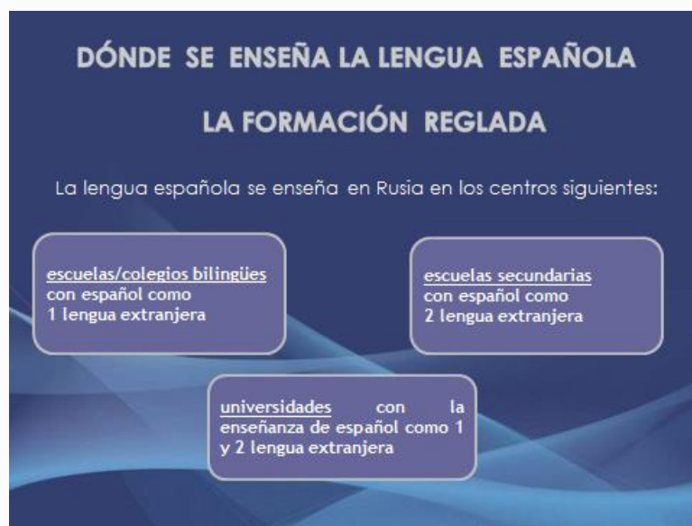
Figura 6. La lengua española en la formación reglada en Rusia

En cuanto al número de alumnos, contamos con los datos de la Agregaduría de Educación de la Embajada de España (2013), relativos a las secciones bilingües y colegios con presencia del español como segunda o tercera lengua extranjera, que cifran el número de estudiantes en torno a treinta mil; a su vez, un reciente estudio de campo de la Universidad Estatal Lingüística de Moscú (2013) cifra el número de estudiantes en la enseñanza media y superior reglada en torno a cincuenta mil.