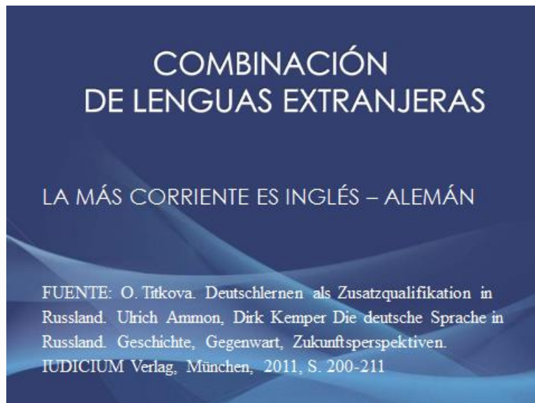
Figura 2. La combinación de lenguas extranjeras en el mercado capitalino

No obstante, el estudio del mercado laboral realizado en 5 ciudades rusas de más de un millón de habitantes, de las 15 que hay en total, – Moscú, San Petersburgo, Novosibirsk, Ekaterinburg, Nizhny Novgorod – muestra que el conocimiento del español ocupa el cuarto lugar en la esfera profesional.