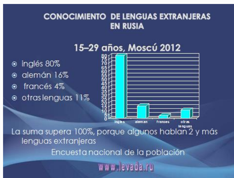
Figura 1. Conocimiento de lenguas extranjeras entre los jóvenes moscovitas

La lengua base para la aplicación práctica de la teoría de la internacionalización es el inglés. En inglés reciben educación prestigiosa (en Gran Bretaña y EE.UU.) los jóvenes de muchos países. Rusia es un gran mercado educativo, donde se inicia una dura lucha competitiva por un alumno no sólo a nivel nacional, sino también a nivel internacional, en primer lugar europeo. El conocimiento de la lengua extranjera es una condición básica e imprescindible, sine qua non, para los estudios fuera del país. En la Figura 1 está representado el conocimiento de lenguas extranjeras entre los jóvenes moscovitas de 15 a 29 años.