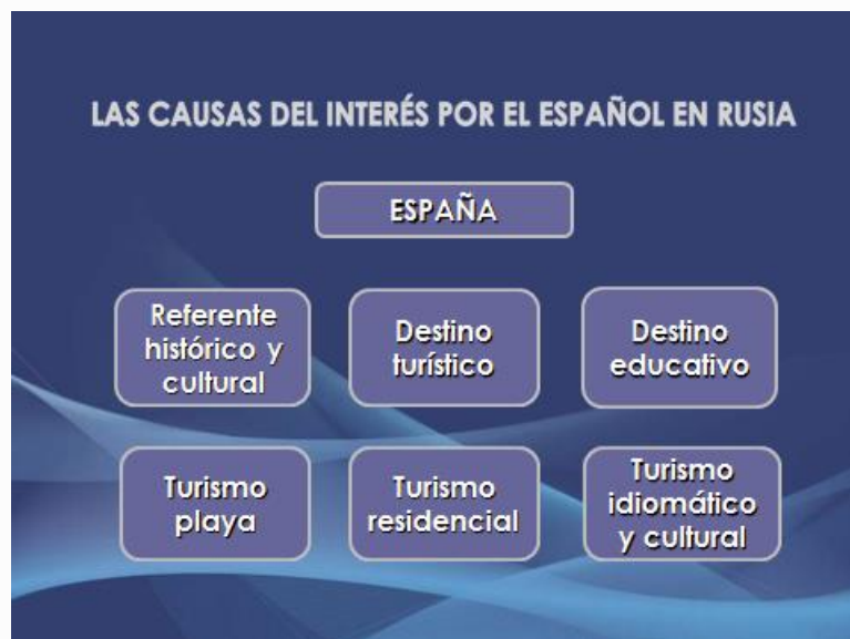
Figura 5. Los destinos del español para los ciudadanos rusos

Este aumento del interés por el español en Rusia está inspirado por el sector turístico, la capacidad de viajar, la inversión inmobiliaria, etc., de la población rusa