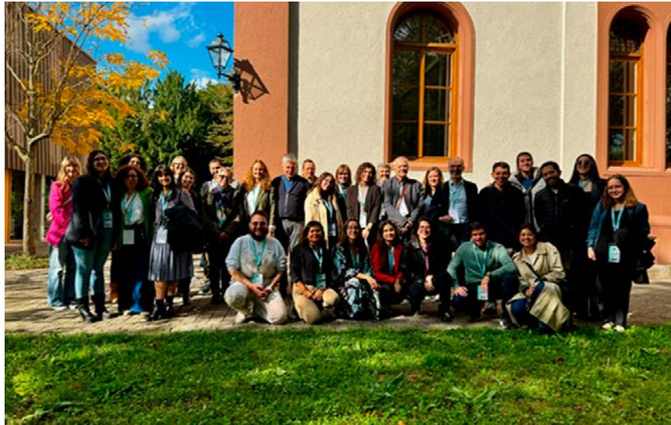
EJIHS Basilea 2024