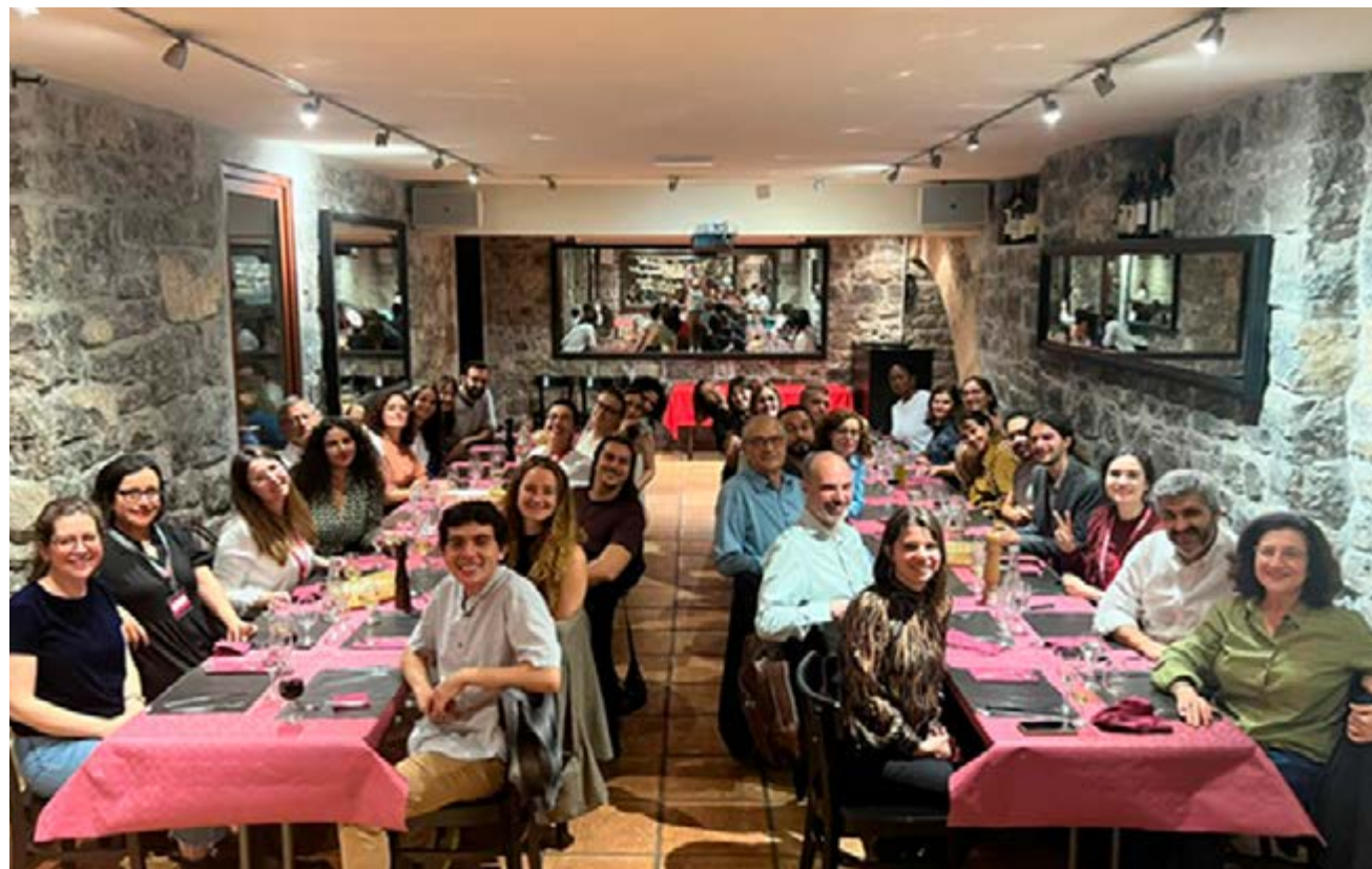
EJIHS Ginebra 2023