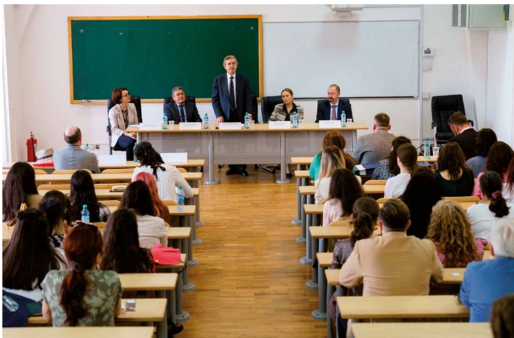
XVI Festival de Teatru Școlar în limba spaniolă

Cel mai important program, datorită dimensiunii geografice și afluenței, este cel al Secțiilor Bilingve. În România, programul își are cadrul legal în Acordul dintre Ministerul Educației și Cercetării din România și Ministerul Educației și Științei din Spania privind crearea și funcționarea secțiilor bilingve româno-spaniole în liceele românești și organizarea examenului de bacalaureat în aceste unități de învățământ, semnat la București în 2007. În anul școlar 2021-22, există unsprezece secții bilingve situate în principalele orașe din România, care deservește aproximativ 1.000 de elevi, la care trebuie adăugați alți trei mii, care învață limba spaniolă în afara Secției. Fiecare secție are un profesor de limba spaniolă care aparține programului.