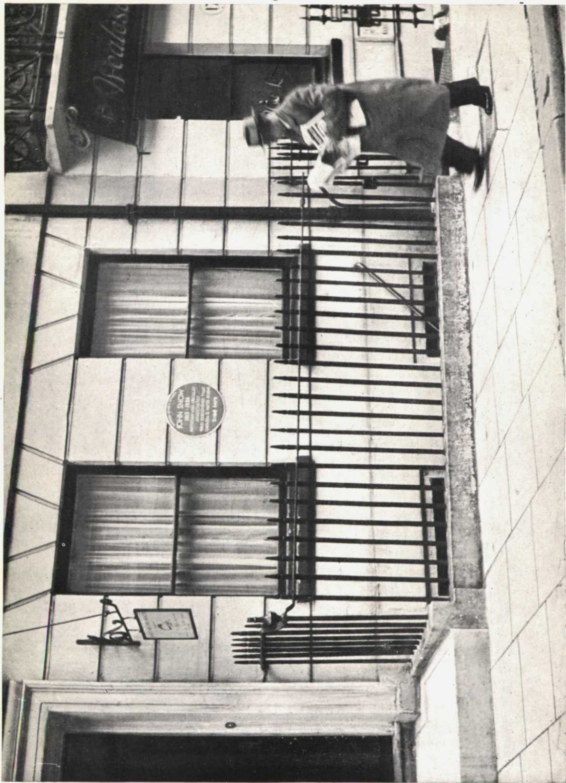
Un disco azul y blanco en la pared de una casa de Londres señala el lugar en que vivió un hombre famoso. Este está dedicado al Dr. John Snow, que descubrió que el cólera se transmite con el agua e hizo mucho en la lucha contra esa peligrosa enfermedad. Para poder fijar esas placas han de pasar veinte años. Las conserva el Ayuntamiento del Condado de Londres.