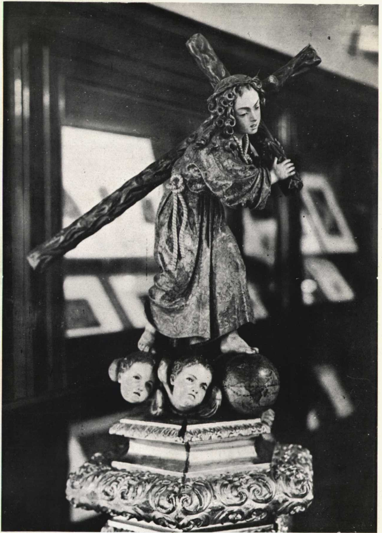
Talla atribuída a Pedro de Mena, expuesta en la Exposición de la Biblioteca Nacional