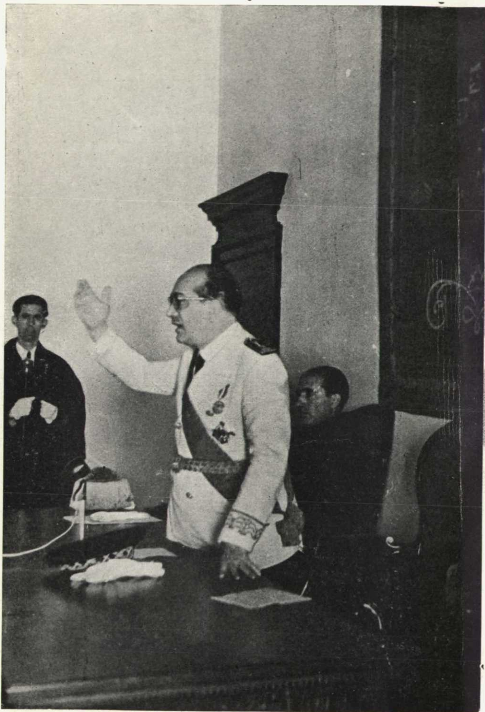
El Ministro de Educación Nacional, D. José Ibáñez Martín, en el discurso inaugural del nuevo edificio de la Facultad de Letras granadina