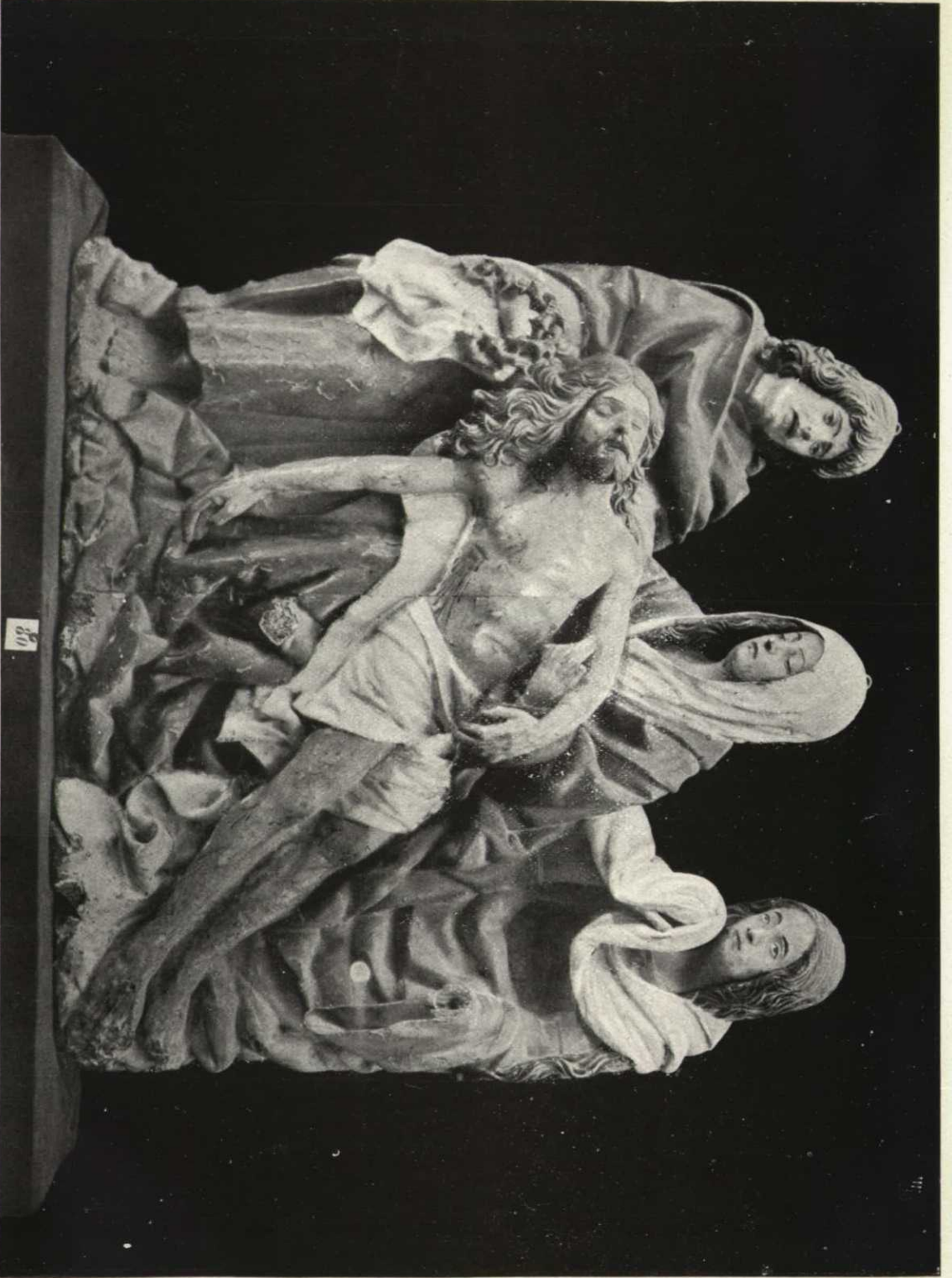
«Piedad».—Talla en madera de autor anónimo.—Siglo XV.—Parroquia de Santa Agueda (Santa Gadea), de Burgos.