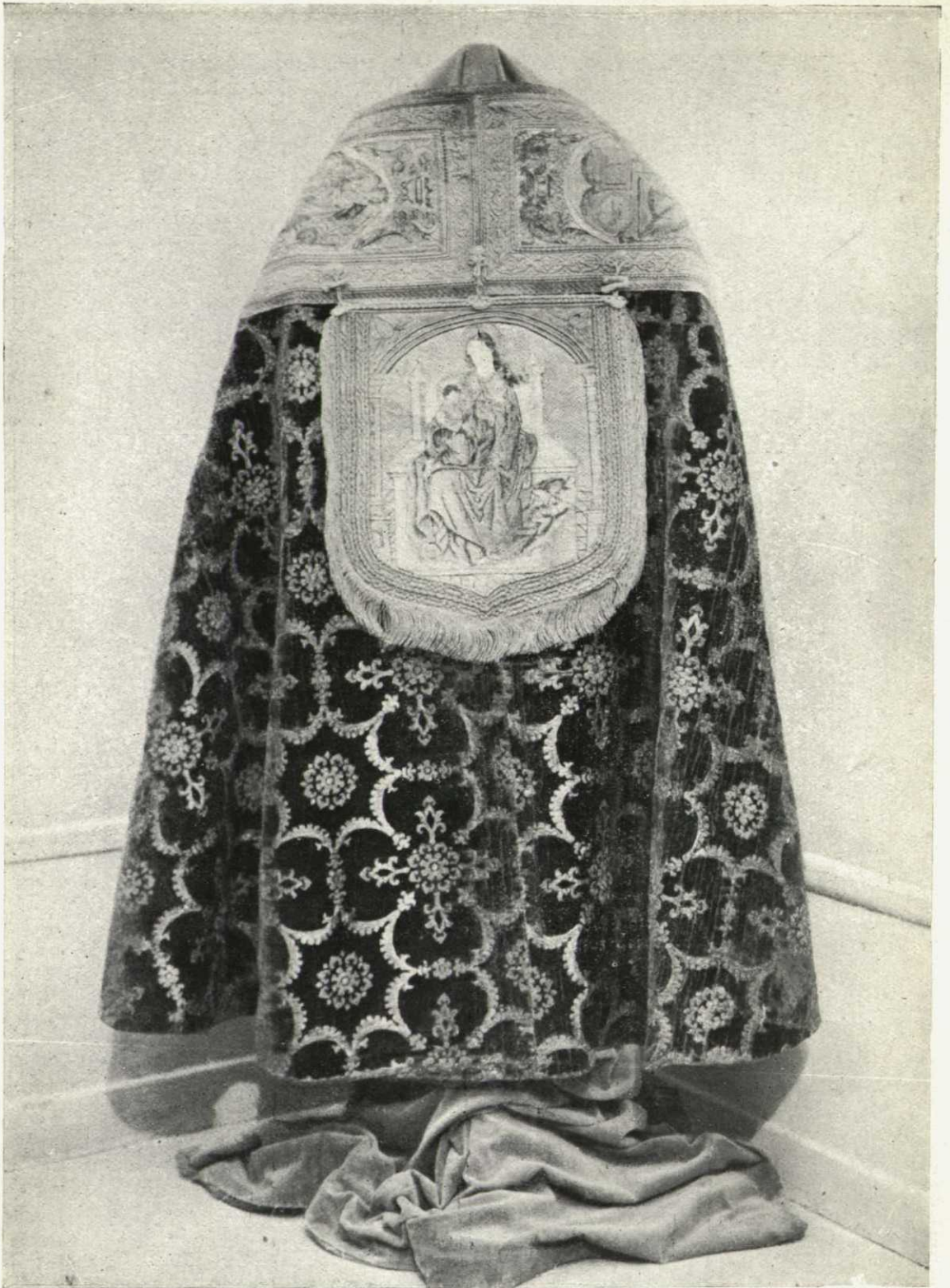
Capa morada de San Miguel de Pedroso, conservada en el Museo de la Catedral de Burgos.—Siglo XV.