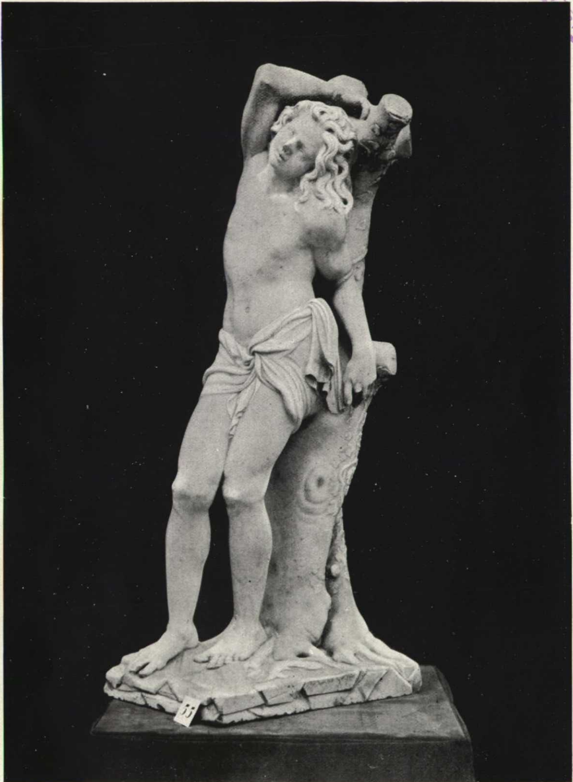
«San Sebastián».—Escultura en mármol de Diego de Siloé.—Siglo XVI (parroquia de Barbadillo de Herreros).