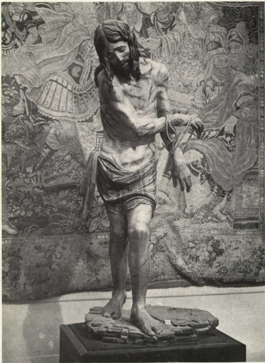
«Cristo», de Diego de Siloé.—Siglo XVI. (Catedral de Burgos.)