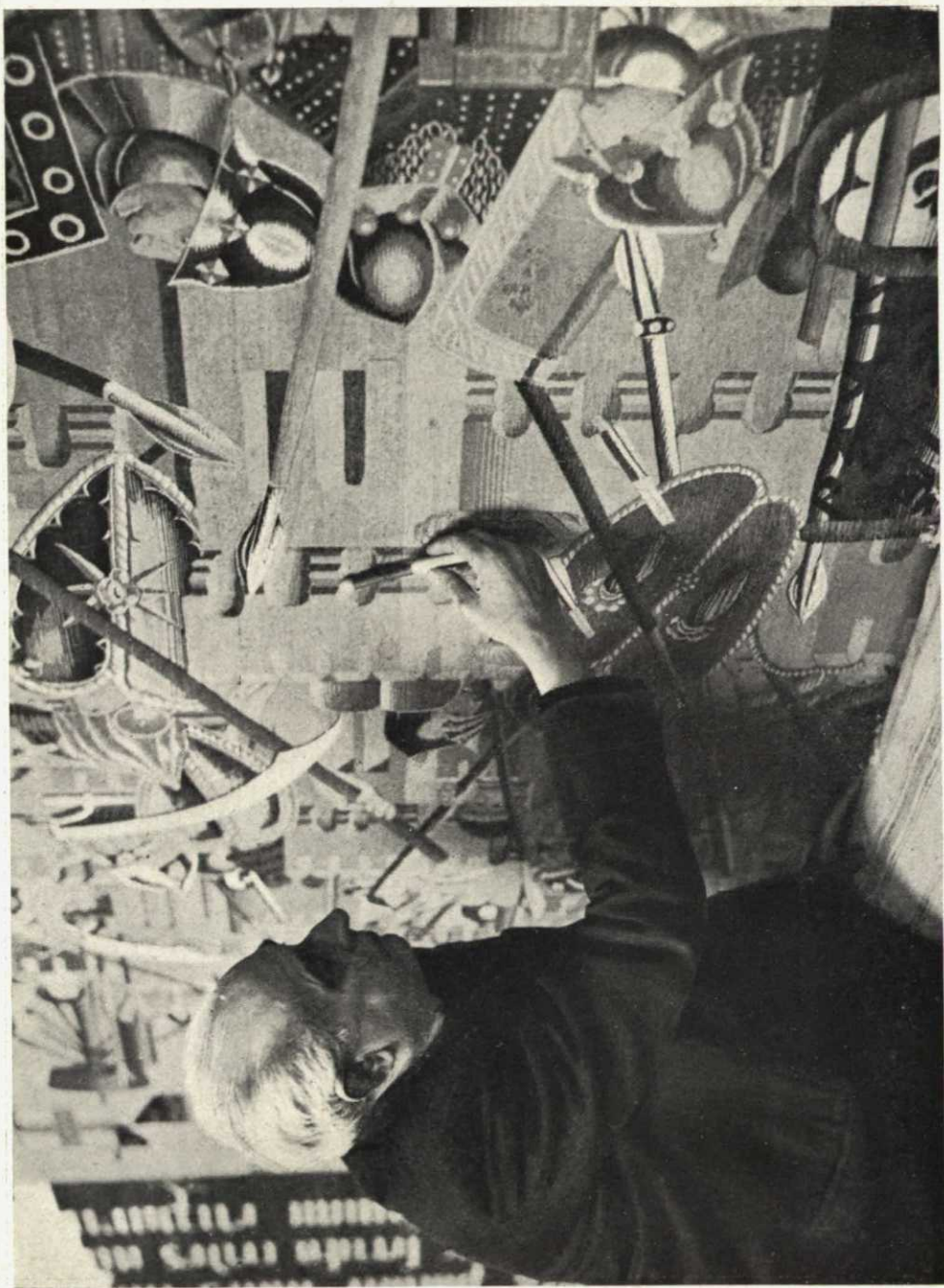
Un oficial tejedor compara el color de un tapiz con el color de la canilla que va a servir para la reproducción del primitivo tapiz