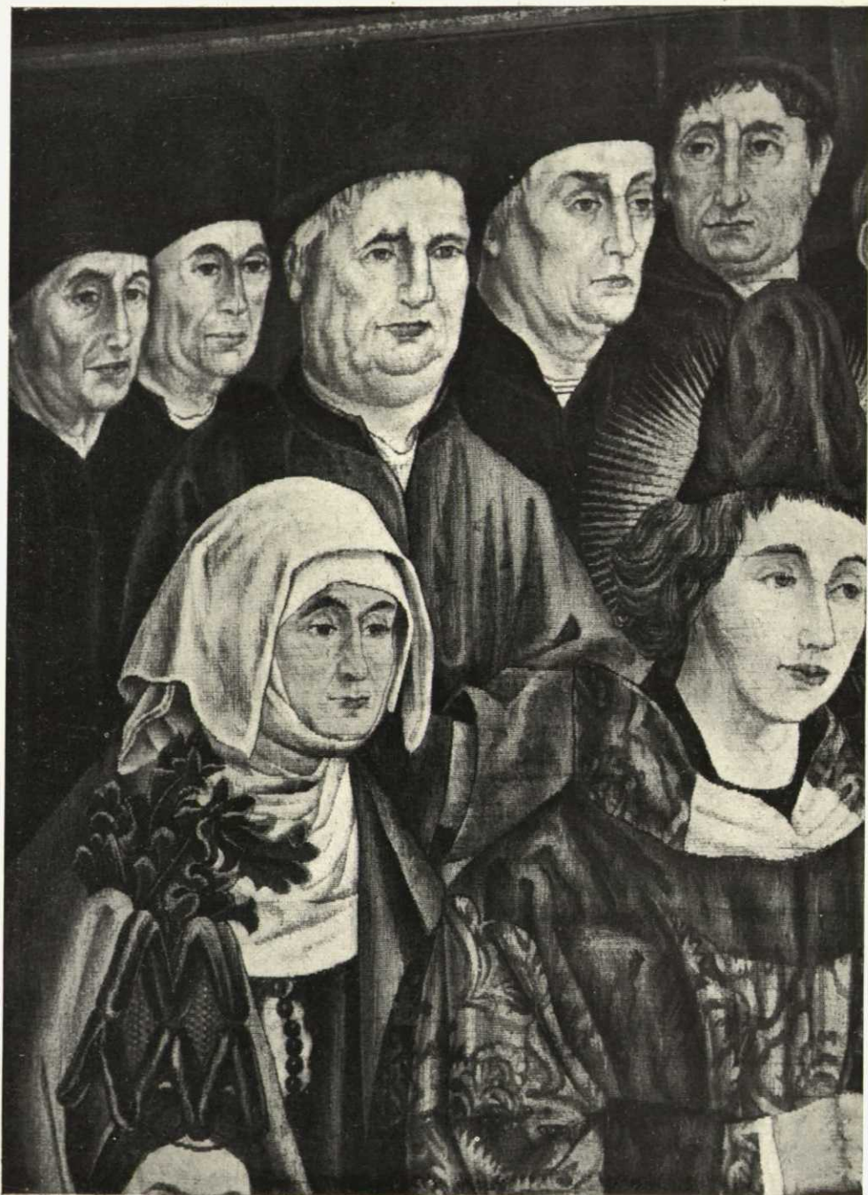
Un fragmento del tríptico «San Vicente», de Nuño Gonzales