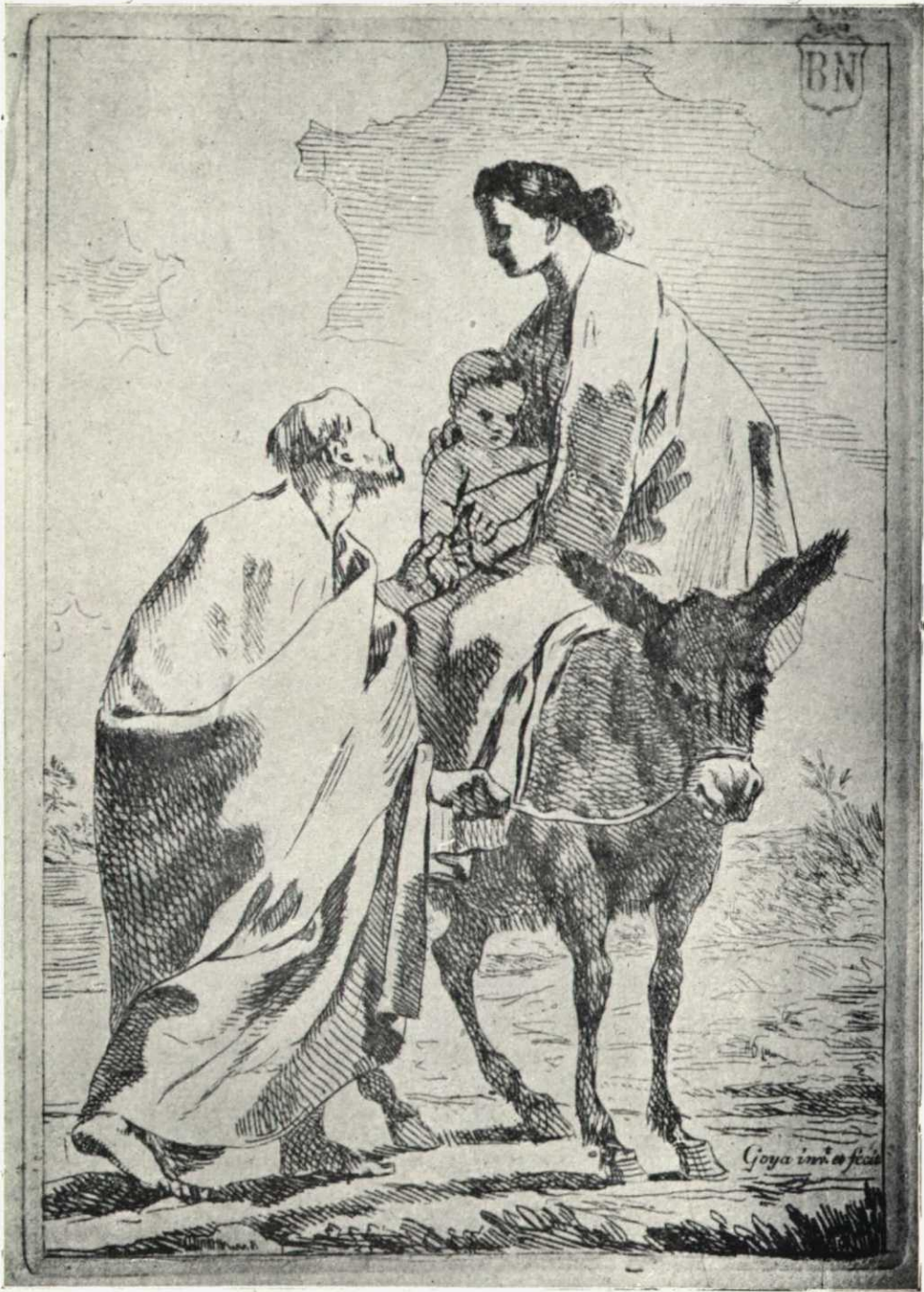
La huida a Egipto, grabado de Goya