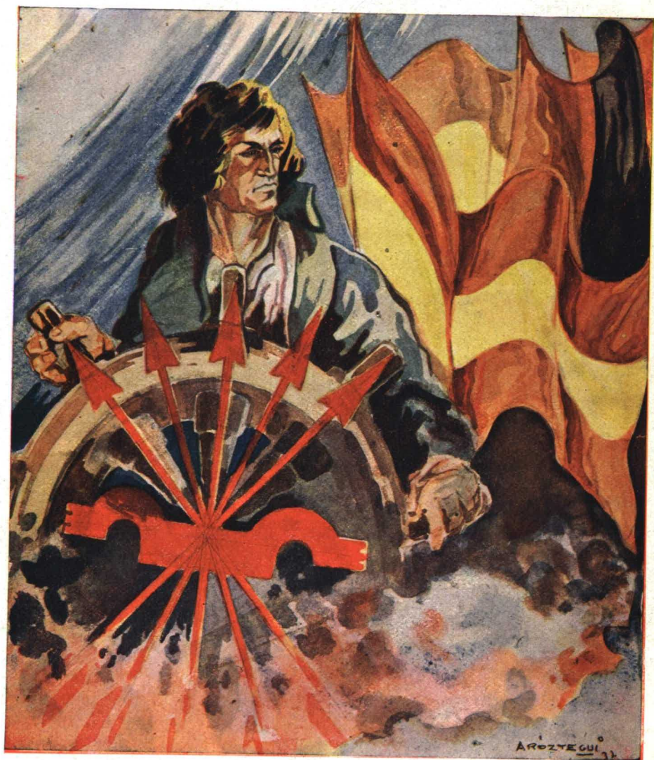
(Portada de una revista infantil)