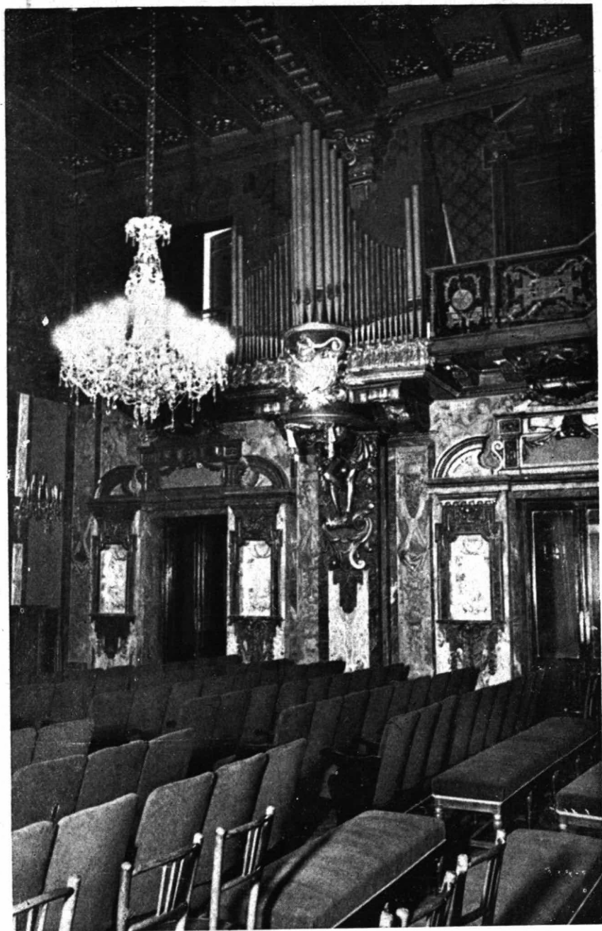
Un aspecto del salón de actos del Conservatorio recientemente inaugurado.