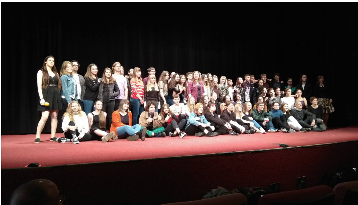
Školní divadelní festival ve španělštině, Olomouc 2019