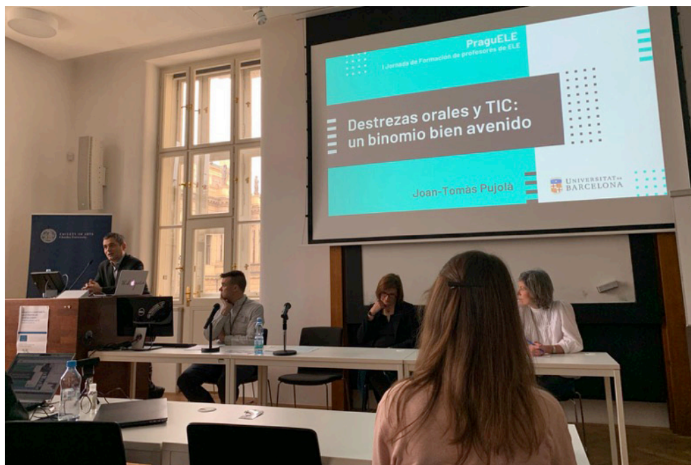
PraguELE, 1. workshop pro učitele španělštiny, 2020

Hlavními partnery této spolupráce jsou významné instituce jako například Institut Cervantes v Praze, katedry románských jazyků na českých vysokých školách, Asociace učitelů španělštiny, ale také samotní učitelé ze všech úrovní vzdělávacího systému. Často také za přítomnosti ostatních představitelů Velvyslanectví Španělska probíhají kurzy, přednášky, setkání a besedy, jejichž tématem jsou nejrozličnější aspekty španělské kultury a jazyka.