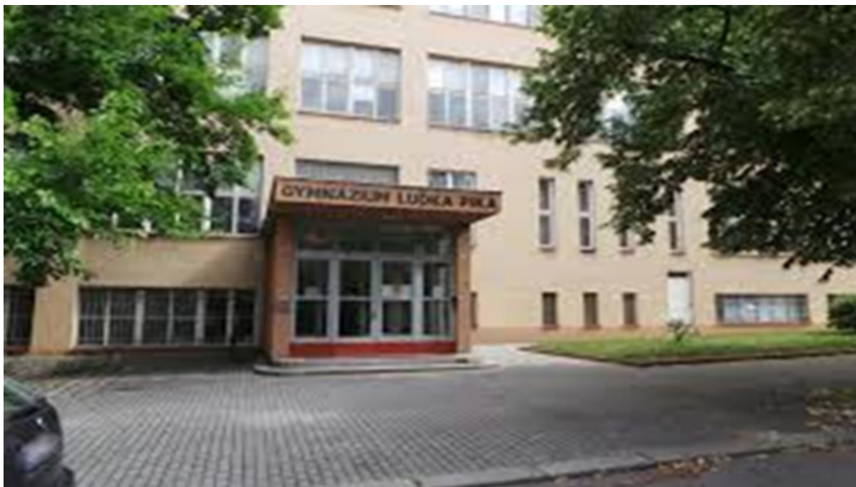
Gymnázium Lud'ka Pika v Plzni

Prováděcí plán spolupráce v oblasti školství a kultury mezi vládou České republiky a vládou Španělského království a Ujednání mezi Ministerstvem školství, mládeže a tělovýchovy ČR a Ministerstvem školství, kultury a sportu Španělska o zřízení a činnosti česko-španělských tříd na gymnáziích v ČR tvoří rámec, který upravuje podmínky dvojjazyčné výuky ve španělštině. V současné době existuje šest dvojjazyčných sekcí, rozmístěných po celé zemi. Otevření šesté česko-španělské sekce v září 2007 na gymnáziu Lud'ka Pika v Plzni znovu potvrdilo zájem o program bilingvních sekcí v České republice. A zároveň probíhají jednání ohledně aktualizace současného Ujednání.