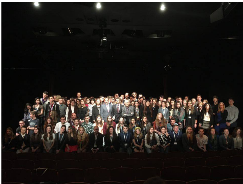
23. mezinárodní festival studentského divadla ve španělštině