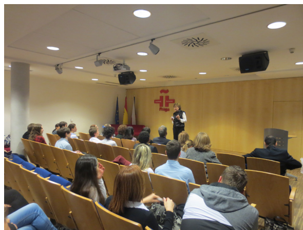
Vyhlašování vítězů ústředního kola jazykové zkoušky ze španělštiny v Institutu Cervantes v Praze