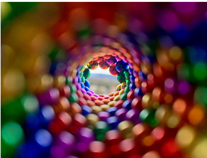
Mención honorífica 2024 Un camino matemático-mágico hacia la vida de Agáta Jelínková, Escuela Primaria Filosófská de Praga