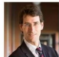
Gonzalo Capellán Consejero de Educación