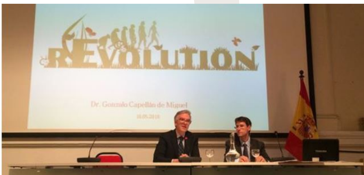
Conferencia en el Instituto Cervantes de Mánchester

Entre el público asistente había científicos y representantes universitarios locales, así como un buen número de alumnos del Instituto Cervantes.