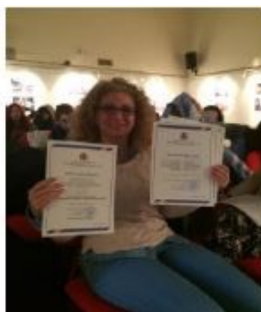
Ganadoras del premio al Mejor Tándem 2015-2016