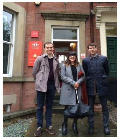
Visita a Leeds