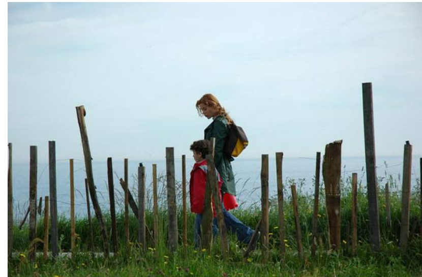
El orfanato (J. A. Bayona 2007)