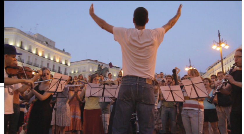
Libre te quiero (Patino 2012)