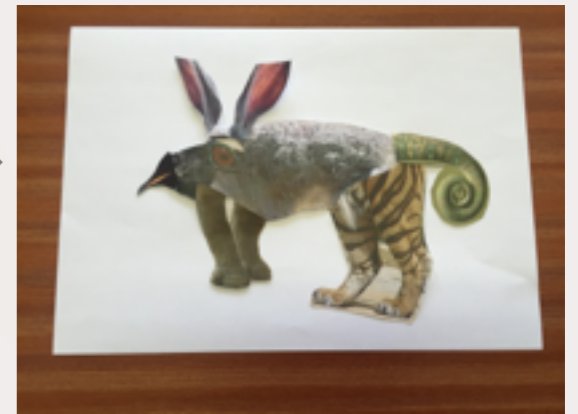
un bicho extraño