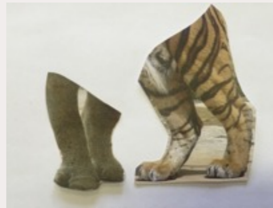
los pies/las patas