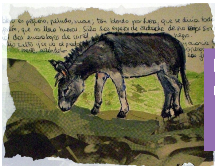
Platero es pequeño, peludo, suave...