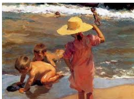
Niños a la orilla del mar