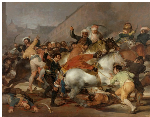
El dos de mayo de 1808 en Madrid o La carga de los mamelucos

Formando pareja con este cuadro, Goya pintó también El dos de mayo de 1808 en Madrid , que representa la lucha del pueblo español contra los mamelucos, mercenarios egipcios que combaten al lado del ejército francés.