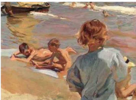
Niños en la playa

Otros cuadros de la misma etapa del autor, de contenido y de similares características son: