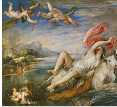
El rapto de Europa (1628), Zeus transformado en un toro blanco seduce a Europa. Cuadro que Velázquez representó como el tapiz que tejió en La fábula de Aracne.

El lienzo fue ensanchado por sus cuatro costados, por lo cual dichas partes (como una ventana circular en lo alto) no fueron pintadas por Velázquez.