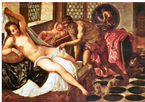
Tintoretto, Venus y Marte sorprendidos por Vulcano (1550-55)

El tema tenía poca tradición iconográfica. Algo más corriente era representar el momento inmediatamente posterior, donde Ovidio presenta a Vulcano sorprendiendo a los adúlteros y apresándolos en una red.