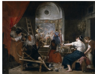
El cuadro con el añadido