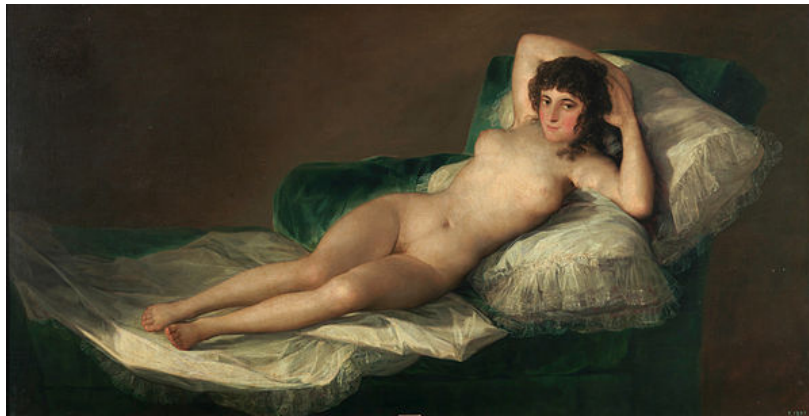
La maja desnuda

En origen, esta pintura y su “hermana”, La maja desnuda , recibían el nombre de «gitanas» y no de «majas». En ambas se retrata a la misma mujer recostada en un lecho y mirando directamente al observador. Goya la pintó con pinceladas sueltas, pastosas y muy libres, a diferencia de la Maja desnuda , en que el pintor es más cuidadoso en el tratamiento de las carnaduras y sombreados. La figura de la maja está bañada con una luz que destaca las diferentes texturas.