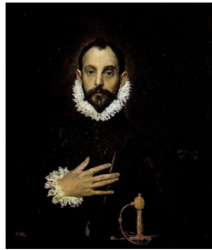
Antes de la restauración

Es uno de los retratos españoles más conocidos en el mundo. Un caballero con la mano en el pecho mira al espectador como si hiciese un pacto con él. La postura de la mano parece un gesto de juramento. Este hombre está vestido de forma fina y elegante y porta una espada dorada. De oro es también el medallón con la cadena que lleva. En su tiempo se convirtió en la representación clásica y honorable del español del Siglo de Oro.