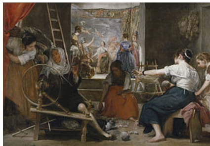
El cuadro original

El lienzo fue ensanchado por sus cuatro costados, por lo cual dichas partes (como una ventana circular en lo alto) no fueron pintadas por Velázquez.