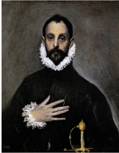
Después de la restauración