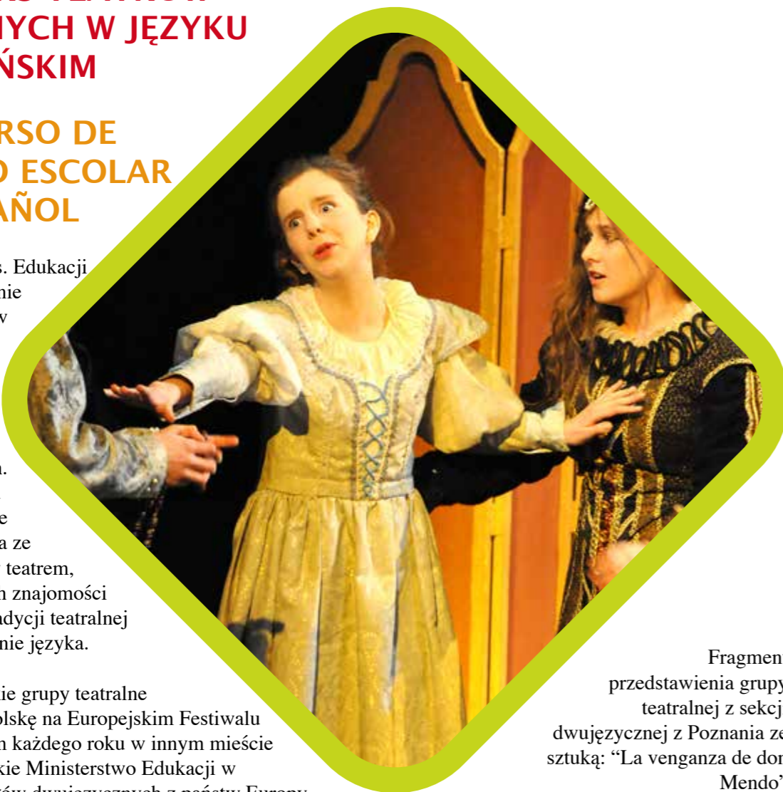
Fragment przedstawienia grupy teatralnej z sekcji dwujęzycznej z Poznania ze sztuką: "La venganza de don Mendo"

Dwie zwycięskie grupy teatralne reprezentują Polskę na Europejskim Festiwalu organizowanym każdego roku w innym mieście przez hiszpańskie Ministerstwo Edukacji w ramach oddziałów dwujęzycznych z państw Europy Środkowowschodniej.