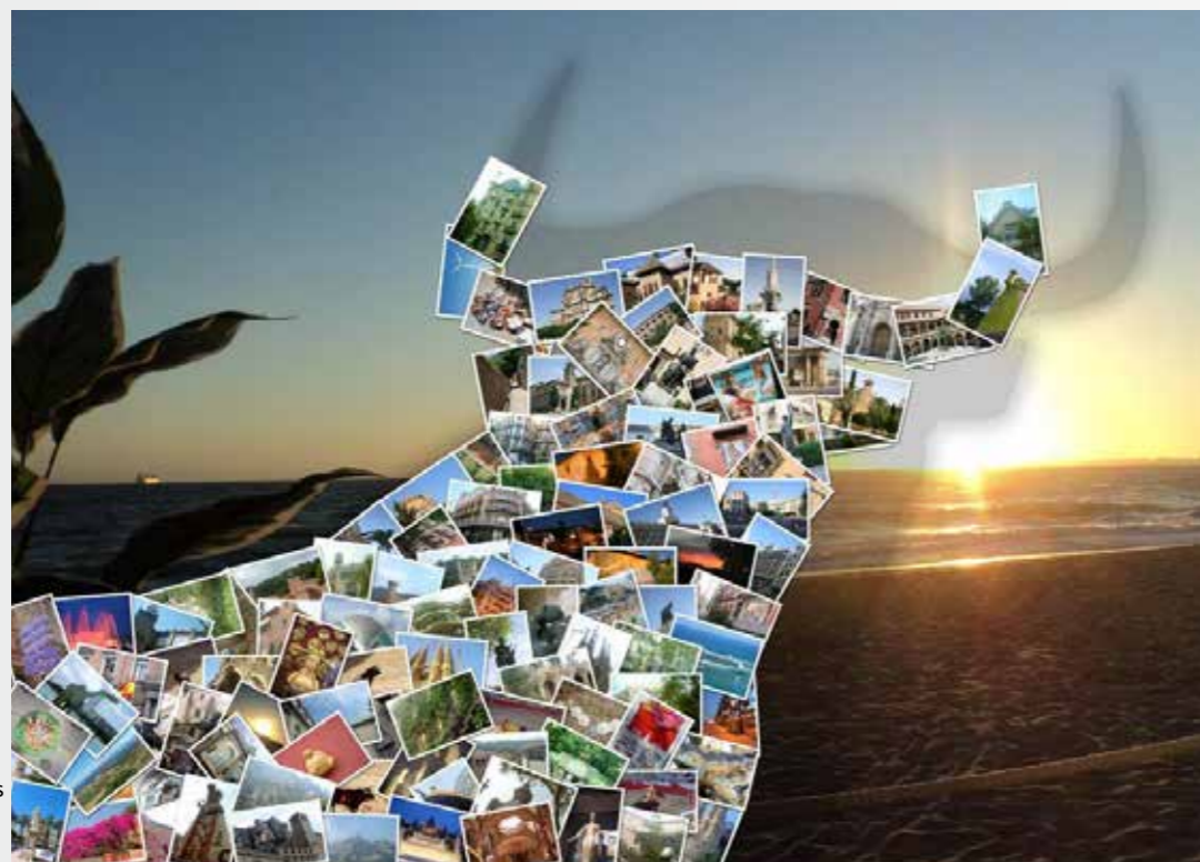
Finalista Międzynarodowego Konkursu Fotomontażu "Colores de España" 2012

Temat konkursu powiązany z Hiszpanią i jej kulturą. Dwa etapy: krajowy i międzynarodowy.