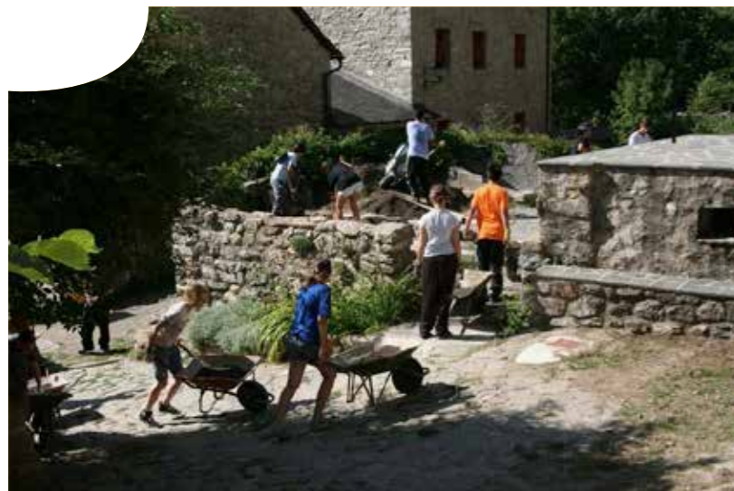
Program renowacji i dydaktycznego wykorzystania opuszczonych miejscowości.

Program jest bezpłatny, poza kosztami podróży.