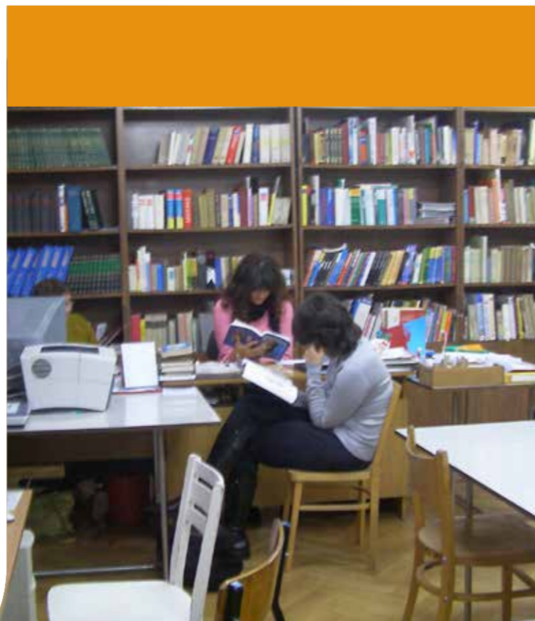
Biblioteka w IX Liceum Ogólnokształcącym we Wrocławiu

Każdego roku hiszpańskie Ministerstwo Edukacji dostarcza materiały dydaktyczne do nauki języka i literatury, geografii i historii Hiszpanii oraz innych przedmiotów, w zależności od potrzeb szkoły. Przekazane materiały dydaktyczne zasilają zbiory biblioteczne szkoły w dziedzinie języka i kultury Hiszpanii. Po odpowiednim skatalogowaniu nauczyciele oraz uczniowie mogą korzystać z materiałów dydaktycznych na lekcji bądź wypożyczać zgodnie z zasadami określonymi w każdej ze szkół. Można określić odrębne zasady wypożyczania tych materiałów. Podręczniki wypożyczane uczniom na okres roku szkolnego, po jego zakończeniu muszą zostać zwrócone do szkoły w terminie tak, aby kolejne roczniki mogły również z nich korzystać.