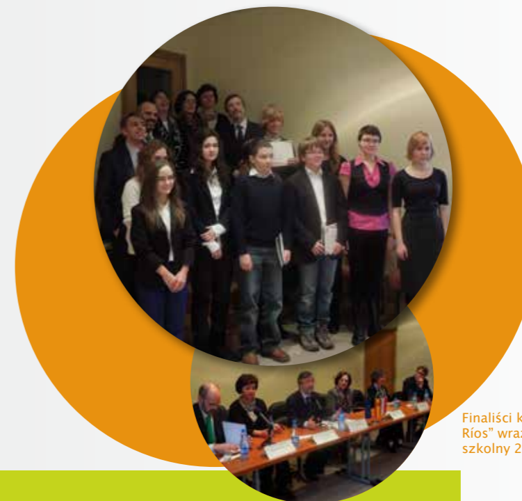
Finaliści konkursu “Giner de los Ríos” wraz z jury. Edycja rok szkolny 2012–2013.

Temat pracy jest dowolny aczkolwiek w niektórych edycjach może być ukierunkowany na tematy nawiązujące do Hiszpanii lub świata hiszpańskojęzycznego.