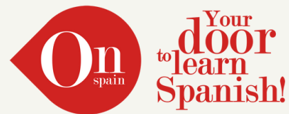
Pepe Cantó Reig