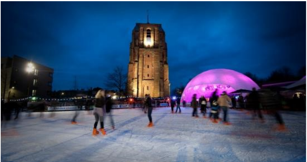
Leeuwarden Capital cultural europea 2018