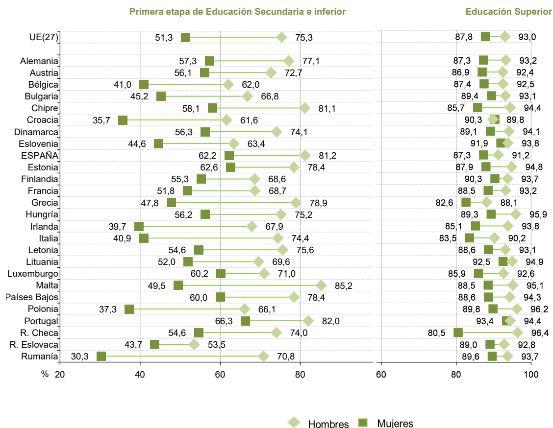
R6.1. Gráfico 4. Tasa de actividad de la población de 25 a 64 años según nivel educativo y sexo en los países de la Unión Europea. 2021