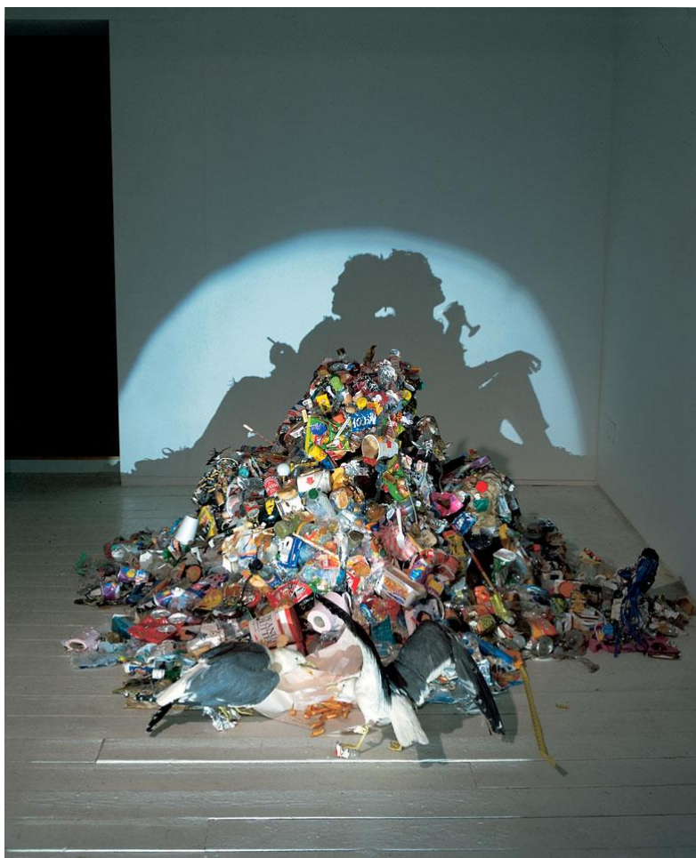
Tim Noble & Sue Webster. Dirty white trash (with gulls) , 1998