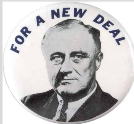
Imagen propagandística de F. D. Roosevelt (1932)