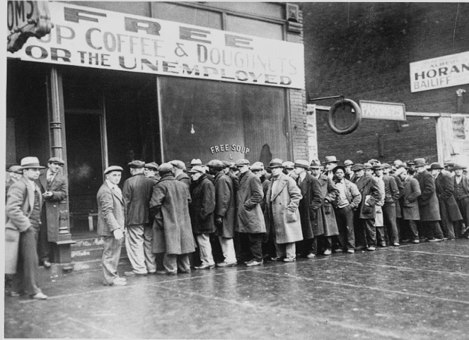
Cola de desempleados. Chicago, 1931