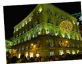
Les décorations de Noël