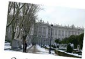
Le Palais Royal