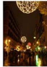
Les rues illuminées