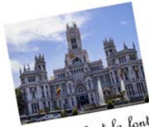
La Mairie de Madrid et la fontaine de Cibeles

Voici quelques images qui peuvent t'aider à raconter tes vacances de Noël à Madrid :