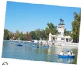
Le parc du Retiro