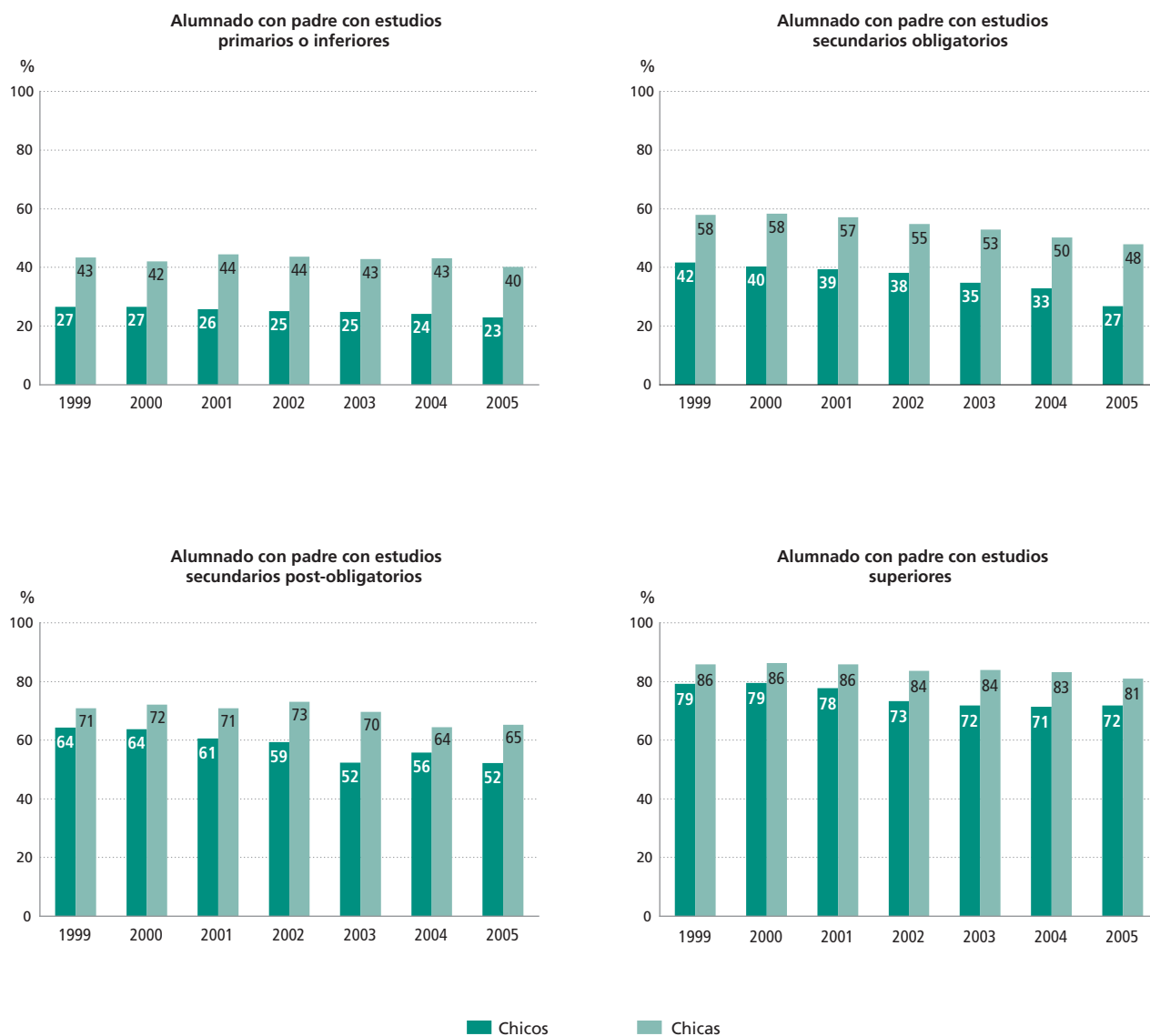
Gráfico 2. Rs8.1: Evolución del porcentaje de alumnado con posibilidades de acceso a la universidad según estudios del padre y sexo.