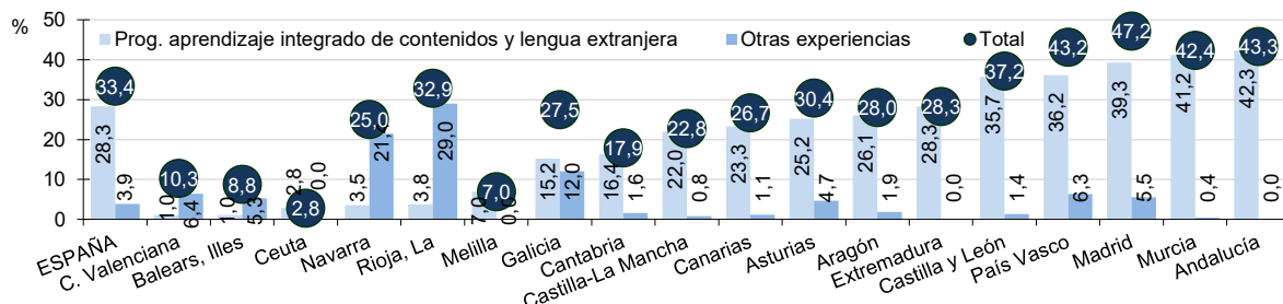
E6.2. Gráfico 4. Porcentaje de alumnado de ESO que participa en experiencias que utilizan una lengua extranjera como lengua de enseñanza. Curso 2019-20

Nota: las CC. AA. están ordenadas de forma creciente según el porcentaje de alumnado de ESO que cursa Programas de aprendizaje integrado de contenidos y lengua extranjera. No se dispone de datos de Cataluña.