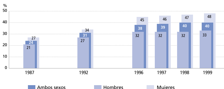
Gráfico 3.E4.1: Variación de la tasa de acceso a la universidad por comunidad autónoma. 1996 a 1999.