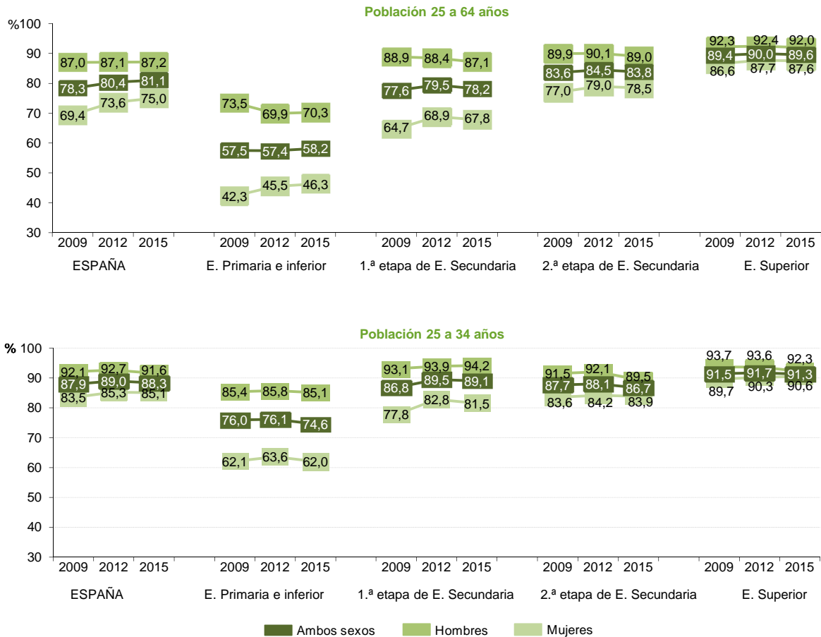
R5.1. Gráfico 2: Tasas de actividad según nivel de formación, edad y comunidad autónoma. 2015.