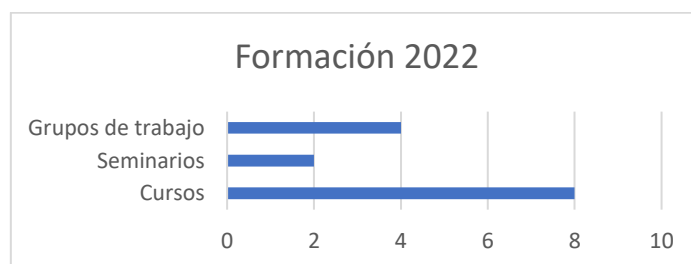
Gráfica 1. Oferta formativa 2022 CEP Cantabria

A lo largo del año 2022, los Centros de Profesorado de Cantabria han organizado un total de 14 formaciones relacionadas con la mejora de la animación a la lectura y la dinamización y gestión de las bibliotecas escolares.