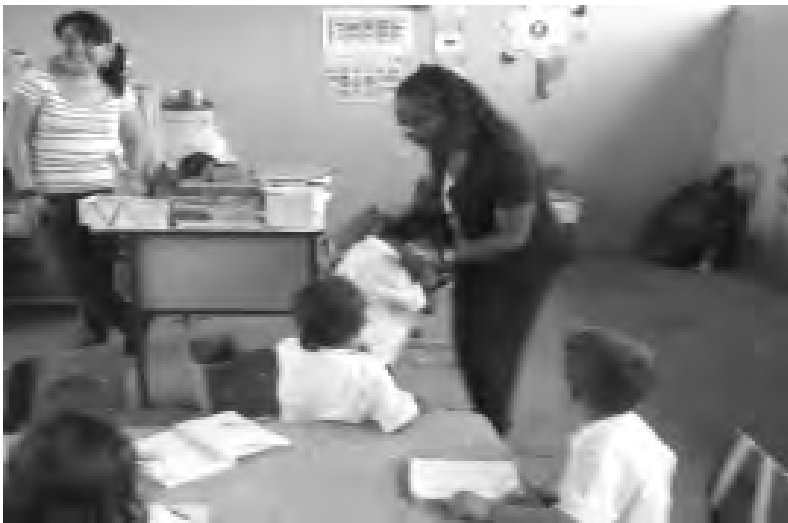
Actividad demostrativa para fortalecimiento de tono muscular.

En ésta etapa el Comité de Educación elaboró un plan de seguimiento para lo cual se nombraron docentes responsables del seguimiento y monitoreo en cada zona. El plan contiene las siguientes actividades: