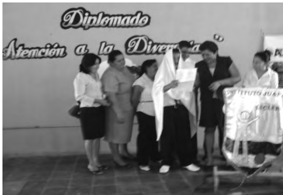
Clausura del Diplomado Atención a la Diversidad.

Un factor fundamental es la formación y capacitación de los involucrados en temas específicos relacionados con el proceso de inclusión y discapacidad a través del efecto multiplicador que realizan los participantes del diplomado en Atención a la Diversidad.