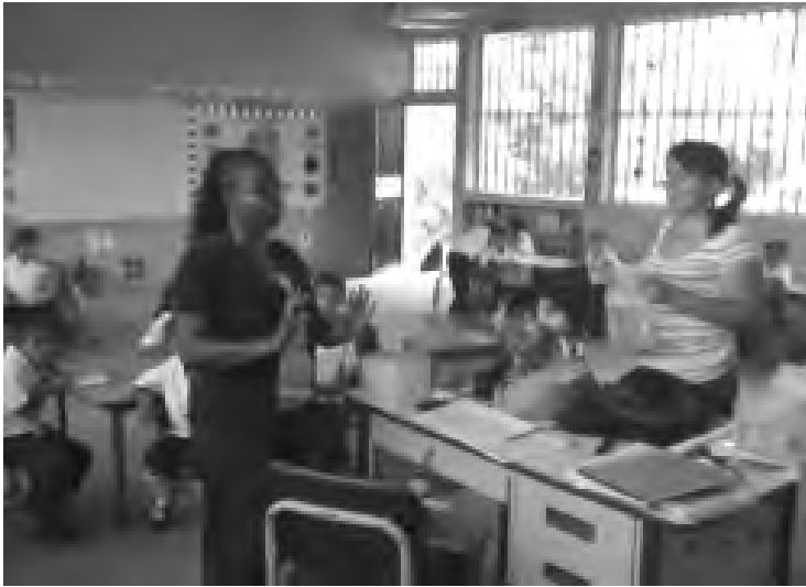
Asistencia Técnica a Maestra del Jardín de Niños Lot Tabora.