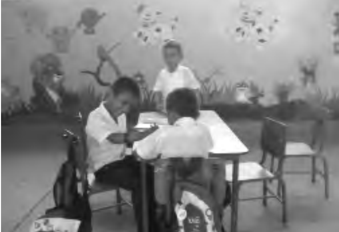
Niño con Parálisis Cerebral integrado en el Jardín de niños Lot Tabora de Combalí, Orocuina.

Cada docente, utilizando métodos y técnicas que favorecen la construcción de aprendizajes significativos, brinda la atención necesaria a los alumnos y alumnas que presentan necesidades educativas especiales, procurando en todo momento proporcionar una atención de calidad.