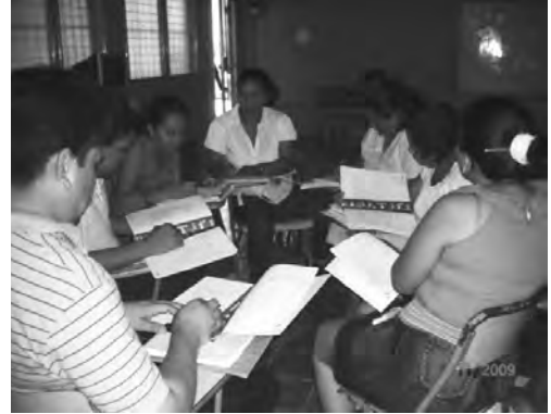
Grupo de Maestros y Maestras participantes del Diplomado “Atención a la Diversidad”.