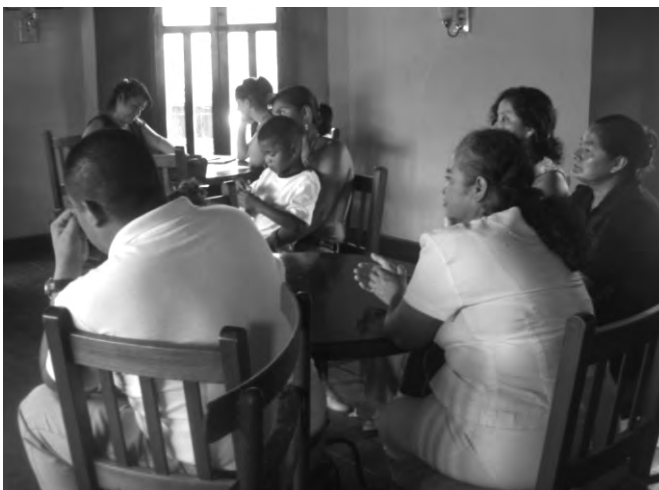
Madres y padres en la reunión inicial.

Esta es una acción fundamental en el proceso, en donde se informa a las madres, padres y/o responsables de los niños y las niñas sobre sus necesidades educativas especiales, se realiza una entrevista inicial en la que se obtiene toda la información acerca de los antecedentes familiares, educativos y de desarrollo físico, social y emocional del niño o niña.