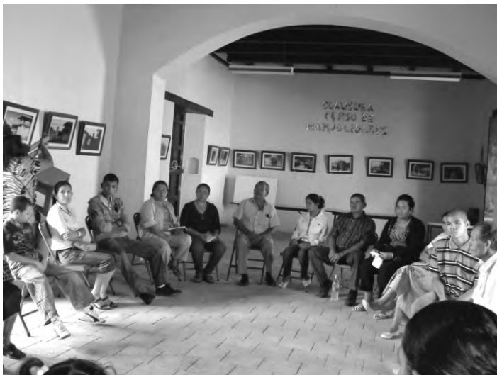
Reunión con los involucrados para la instalación de la mesa de Educación Inclusiva en Apacilagua, Choluteca.

3.2- Organización de la Mesa de Educación Inclusiva como un espacio en donde se comparten las experiencias de los centros educativos y se recuperan las buenas prácticas de cada experiencia.