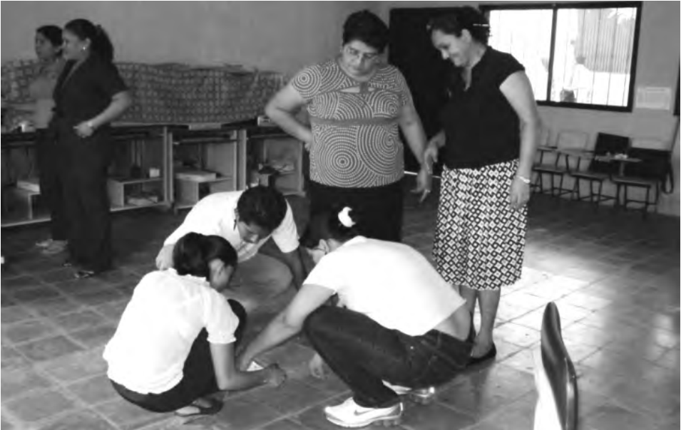
Jornada de sensibilización con Maestros, maestras, Padres y Madres de familia.

2.1- Desarrollo de jornadas de concientización dirigidos al personal de los centros educativos seleccionados, con la finalidad de organizar equipos de apoyo a la inclusión a nivel de los centros educativos, conformados por: el director, como principal responsable del proceso, los padres de los alumnos integrados, un representante de la sociedad de padres de familia del centro educativo, el alumno integrado, un compañero(a), el maestro de grado, un maestro del grado subsiguiente y el maestro itinerante de métodos y recursos.