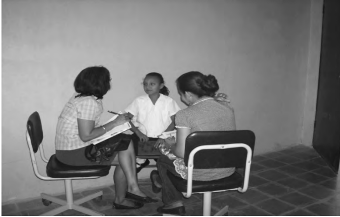
Maestras de la Escuela Urbana “Manuel Bonilla” de Orocuina evaluando una niña con Problemas de Aprendizaje.

El personal docente, tomando en consideración la información obtenida con los padres y las madres de familia, inician la evaluación con una observación detallada del desempeño de los niños y las niñas en la escuela, la que se registra en una lista de cotejo. El siguiente paso es la aplicación de pruebas psicopedagógicas orientadas a la detección de las fortalezas y las necesidades específicas que presenta el estudiantado.