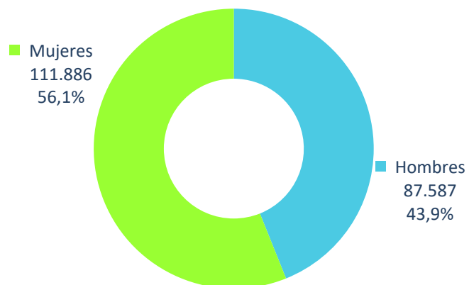
Enseñanzas de carácter formal