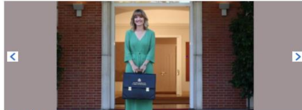
Pilar Alegría Contente, ministra de Educación y Formación Profesional