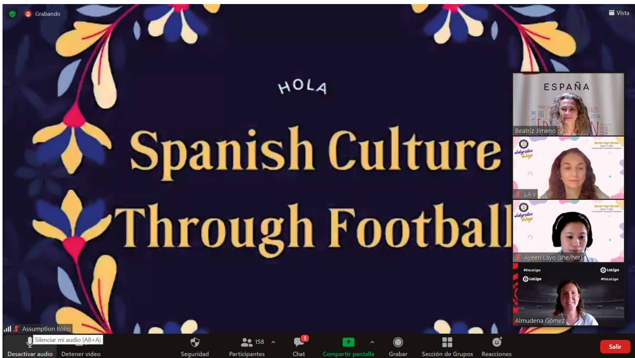
Charlas Culturales con LaLiga. Escuela Secundaria de la Asunción. Marzo 2022