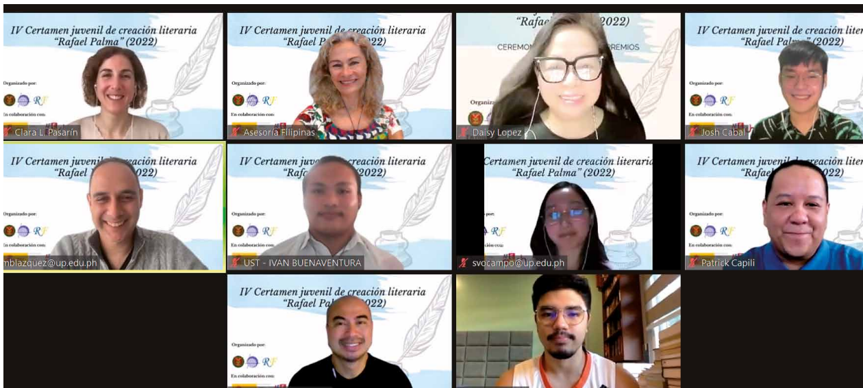
Entrega de premios literarios Rafael Palma. Abril 2022

Entre las universidades que imparten español, tan solo la Universidad de Filipinas Diliman oferta estudios de grado en Estudios Hispánicos. El resto únicamente imparte asignaturas de especialidad. En cuatro de ellas existe un lector de español, financiado por la Agencia Española de Cooperación Internacional para el Desarrollo —«AECID»—. Por otro lado, el grado universitario no suele ser la titulación que poseen los profesores de español, salvo en enseñanza universitaria o centros educativos privados o internacionales.