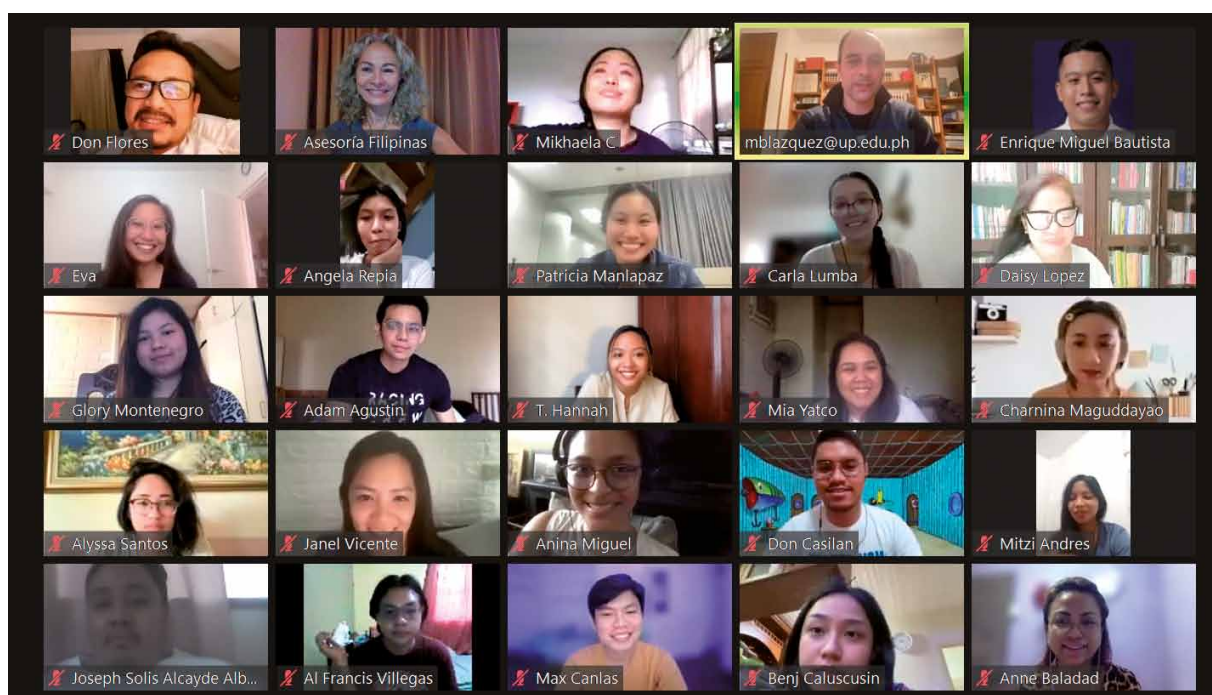
Presentación del programa de Auxiliares de Conversación. Universidad UP Diliman. Octubre 2021

Esta Asesoría está dando prioridad a los candidatos con estudios de español, magisterio y pedagogía, así como a profesores, con la idea de que su aprendizaje en España tenga un mayor impacto de retorno en Filipinas.