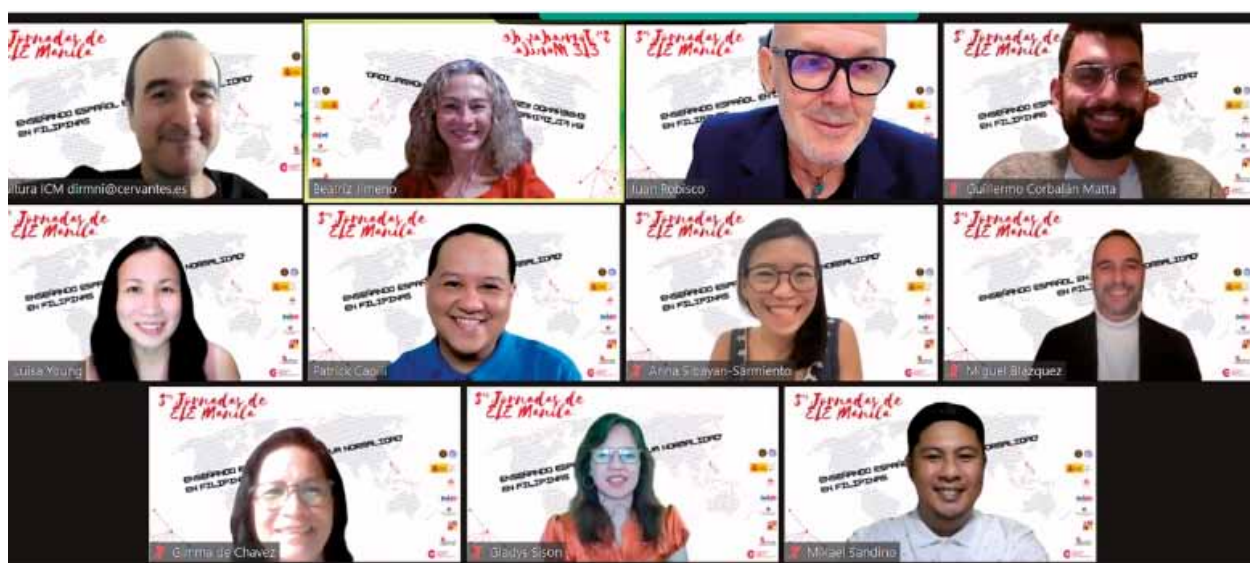
III Jornadas de ELE Manila. 26 y 27 noviembre 2021

En 2022, y gracias a un acuerdo con el Instituto Cervantes y el Ministerio de Educación y Formación Profesional, se va a iniciar un nuevo programa de formación del profesorado de español en los centros de Educación Secundaria del Departamento de Educación Filipino, el «DepEd», equivalente a nuestro Ministerio.