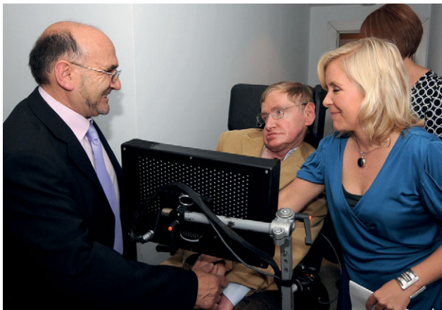
Stephen Hawking y Lucy Hawking con Ubaldo Rueda, Director del IES "Rosálía de Castro". Año 2008

El Premio Bento Spinoza fue creado a finales del 2008 y se presentó públicamente durante la visita de Stephen Hawking a Compostela y a nuestro Instituto, donde pronunció una conferencia. Su hija Lucy Hawking actuó como madrina del premio en su presentación. Este premio nace como hermano del San Clemente de narrativa. El díptico de su presentación define su objetivo en los siguientes términos: "Se propone servir de cauce para que los alumnos gallegos, en el campo del ensayo, puedan expresar su opinión premiando al mejor de cinco ensayos seleccionados entre todos los publicados en el año anterior".