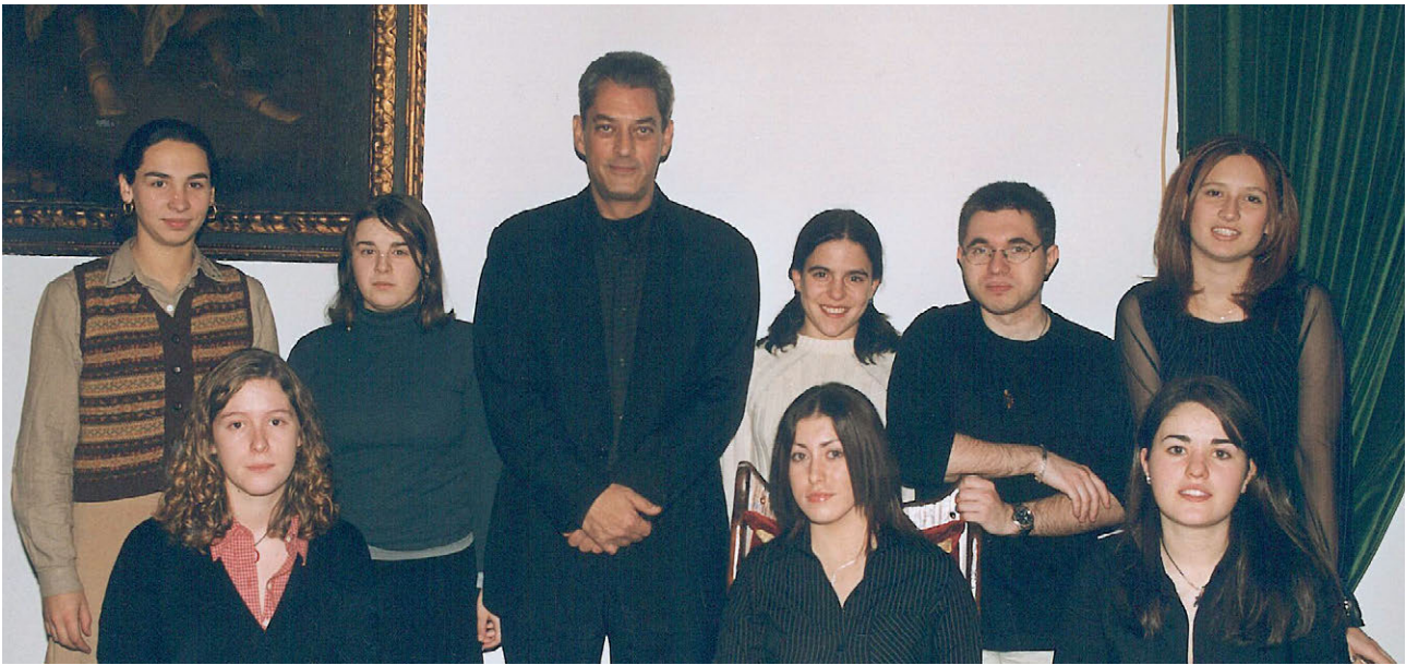
Alumnos, miembros del jurado, con Paul Auster galardonado en la Edición VI. Año 2001.

centros que cada año participan en la convocatoria se constituyen en árbitros que dictaminan sobre la calidad obras literarias y de pensamiento de autores consagrados en los ámbitos nacionales e internacionales.