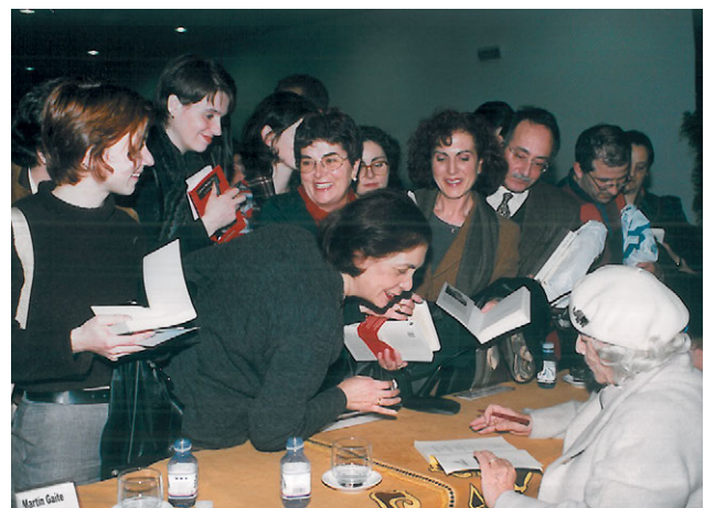
Carmen Martín Gaité, galardonada en la Edición V, firmando sus libros a alumnos y profesores. Año 1999.

La consecución de este objetivo se confirma por el hecho de que la Comisión Organizadora de la actividad pone especial empeño en tomar en consideración, en todo su valor objetivo, el papel del Jurado del Premios, situándolo al mismo nivel que el que juegan los escritores. Y esto por lógica consecuencia: si estos alumnos son el jurado que valorará las obras de los mejores escritores del mundo, merecen ser tratados como tales. Por esta razón, ellos son los protagonistas en todo momento ante los medios de comunicación. Ellos tienen un lugar reservado en primera fila en el auditorio el día de la entrega del premio, y ese día ellos son los únicos protagonistas que actúan conjuntamente con los escritores. Esto tiene un extraordinario efecto identificador del resto de los alumnos con todo el desarrollo de la actuación del Jurado, y especialmente con lo que está sucediendo en el escenario, porque los alumnos se ven representados en sus compañeros miembros del Jurado, entre otras razones, porque éstos han recogido las opiniones de sus compañeros lectores, y han contado con ellas en el momento de emitir libremente su voto en la reunión decisoria del Jurado. Así pues, bien directamente, si los alumnos son miembros del Jurado, o bien indirectamente por representación, si no lo son, todos los alumnos-lectores de los