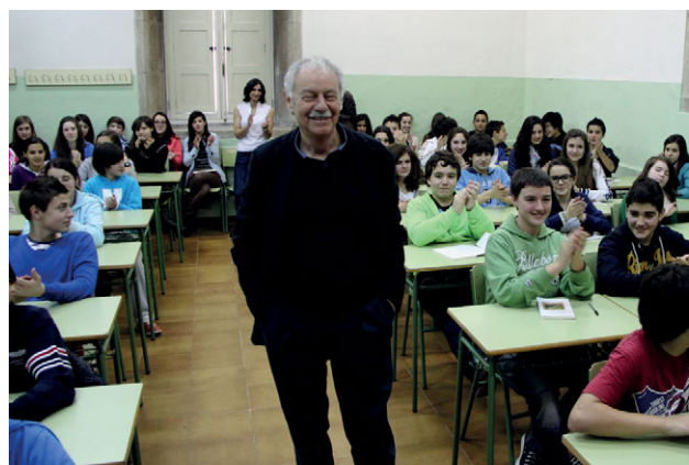
Coloquio de Eduardo Mendoza, galardonado en la Edición XVII, con alumnos de 2º de ESO. Año 2012.

Para llevar adelante este proyecto se nombró un profesor coordinador, máximo responsable de toda la organización del premio, que está al frente del proyecto desde sus orígenes hasta el día de hoy.