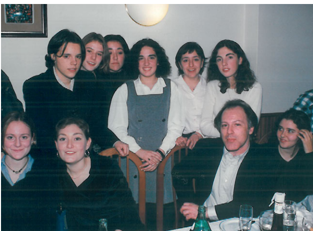
Javier Marías con alumnos miembros del jurado de la Edición II. Año 1996.

La tabla 3 puede darnos una idea de hasta qué punto se habría conseguido el objetivo B, si tomamos en consideración el prestigio internacional de los escritores que acudieron a recibir su premio, aceptando el dictamen de un Jurado de jóvenes alumnos de Secundaria de un centro ubicado en un edificio histórico de una ciudad no menos histórica mundialmente conocida, en un país del extremo occidental europeo; porque muchos de los escritores galardonados reciben numerosas peticiones de comparecencia por parte de enti-