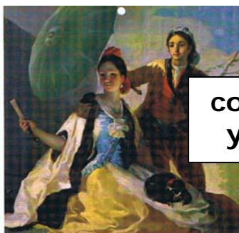
costumbrista y folclórico