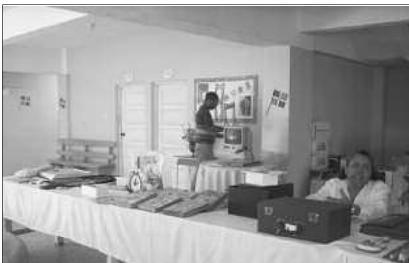
La Directora de la Escuela, junto con los materiales didácticos entregados por FOAL para las escuelas antes de una formación. Se aprecian cuentos, telelupa, elementos de escritura, etc.