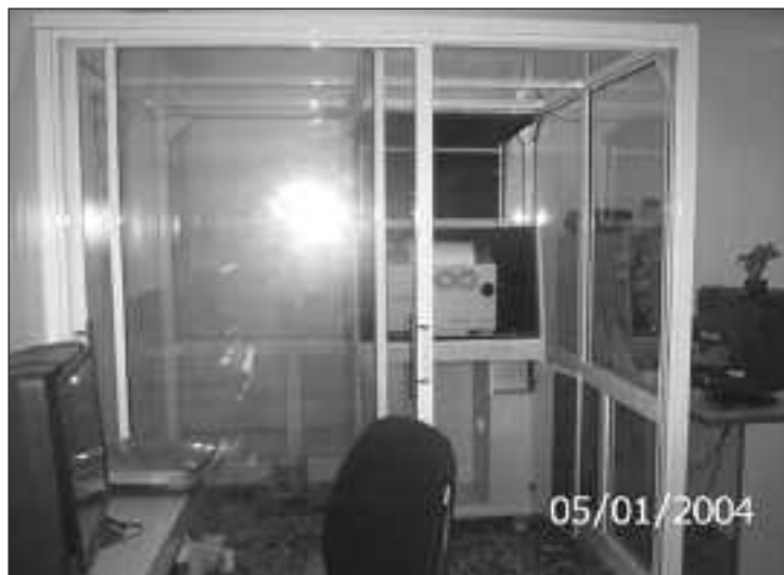
Se puede ver la cabina que el CPTA hizo fabricar para insonorizar la impresora Braille IMPACTO

Las actividades que desarrolla el Centro son planificadas por la dirección del Centro de Recursos, institución de quien dependen. Las actividades son parte del plan anual de trabajo de la institución y es presentada a la dirección de educación especial.