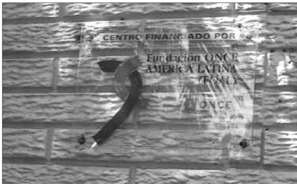
Placa de la FOAL para Visibilizar el Apoyo en la dotación del Centro.

A todos los Centros de Recursos se entregará una placa que recoge la imagen institucional de la FOAL, para ser colocada a la entrada de la sede de trabajo del núcleo de producción. Tanto la placa como las pegatinas son suministradas por FOAL.