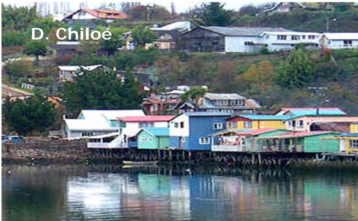
Los robles gigantes y altivos de esta tierra chilota insular en vaivén por el viento se alcanzan en su eterno besar y besa. ( Extracto Himno de Chiloé)