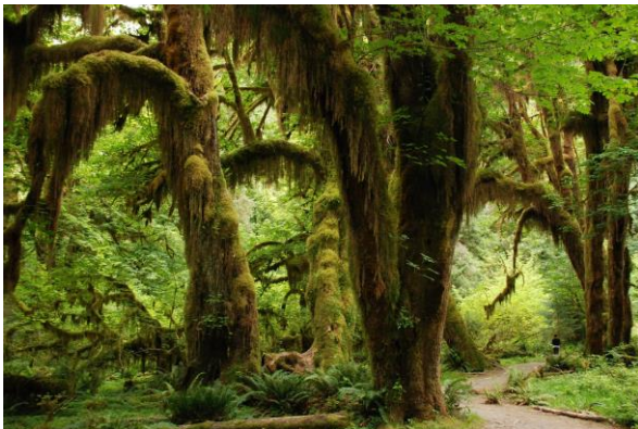
Olympic National Park

En primavera, por otro lado, podrás visitar los campos de tulipanes en La Conner. Más información en la página de turismo del estado de Washington.