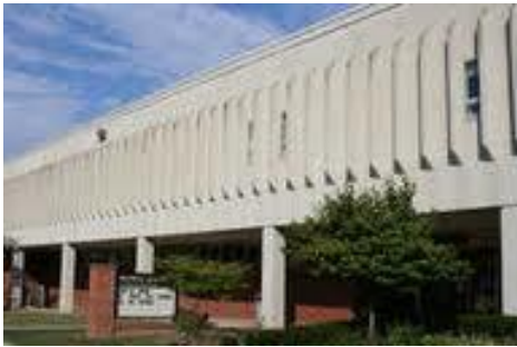
Maxwell Elementary Spanish Immersion