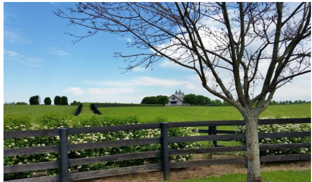
Granja de caballos en Lexington, KY

Email: agregaduria.newyork@educacion.gob.es