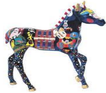
Lexington Horse Capital of the World