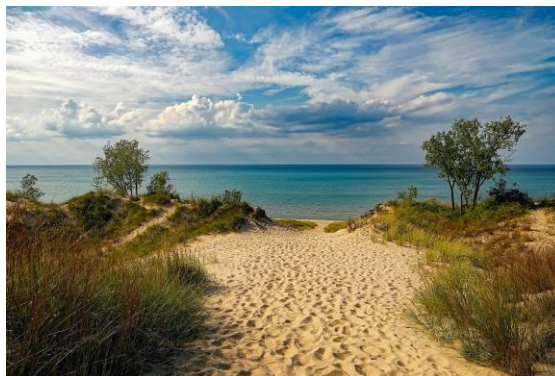
Indiana Dunes State Park

Nota: Si antes de venir a Indiana se quiere tener una idea de sus costumbres, paisaje, cultura, etc., se recomienda ver las películas “Breaking Away” y “Hoosiers”. La primera es fácil de conseguir en España.