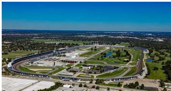
Indianapolis Motor Speedway – Indy 500

La oferta de mercado de las compañías de seguros es muy amplia; sin embargo, no todas las aseguradoras con representación en Indiana tienen autorización legal plena. Para evitar problemas innecesarios, es mejor elegir una compañía estatal, o bien una nacional con representación y cobertura locales. Como medida general, antes de cerrar el contrato, exigir siempre al agente de seguros que os dé el nombre de la compañía, así como la dirección de sus oficinas y el teléfono de las mismas, para contactar con ellas y confirmar la veracidad de los datos y condiciones que figuran en la póliza ofrecida. En el caso de que no fuera posible establecer contacto con la compañía, se desaconseja la contratación de sus servicios.