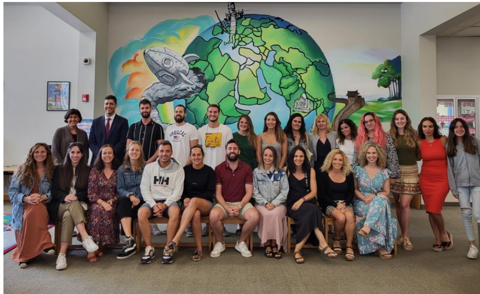
Acogida Profesorado Visitante en Houston

El Programa de Profesorado Visitante se desarrolla de conformidad con el Memorándum de Entendimiento firmado por la Agencia de Educación de Texas, el Consejo Estatal para la Certificación de Educadores de Texas y el Ministerio de Educación, Formación Profesional y Deportes.