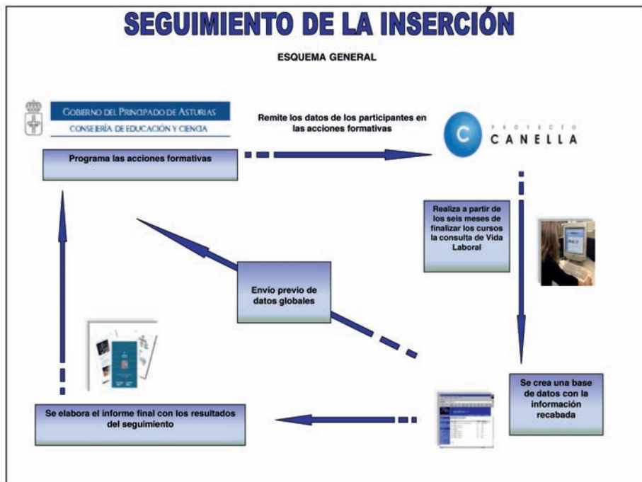
FIGURA II. Seguimiento de la inserción

En el diagrama adjunto se especifica el proceso llevado a cabo (Figura II):